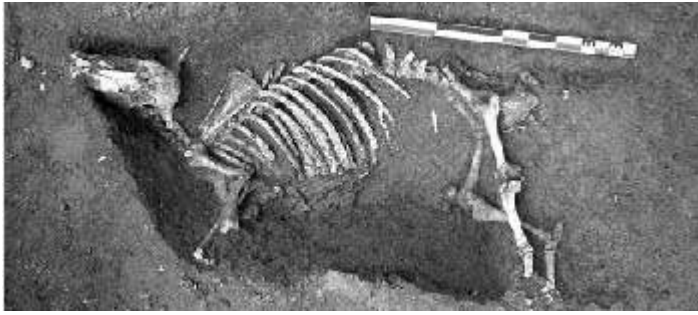
Fig. n°2 : Vue zénithale du jeune boeuf