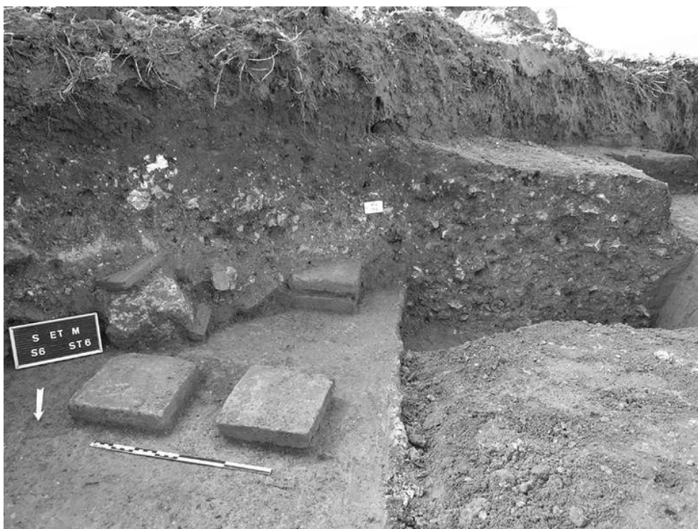
Fig. n°1 : Vue du secteur avec salle sur hypocauste