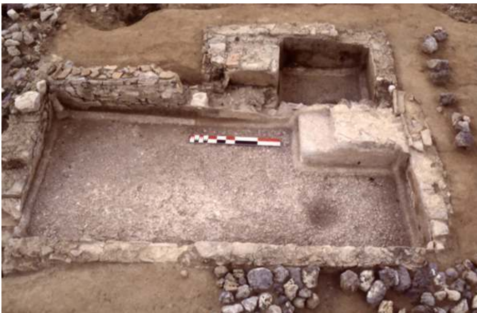
Fig. n°2 : État ancien des cuves