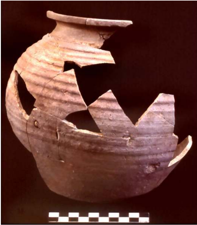
Fig. n°5 : Urne en céramique kaolinitique

Auteur(s) : Druelle, P. Crédits : ADLFI (2004)