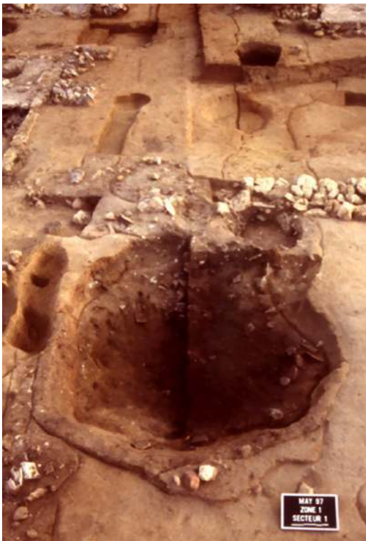
Fig. n°4 : Dépotoir de scories de fer