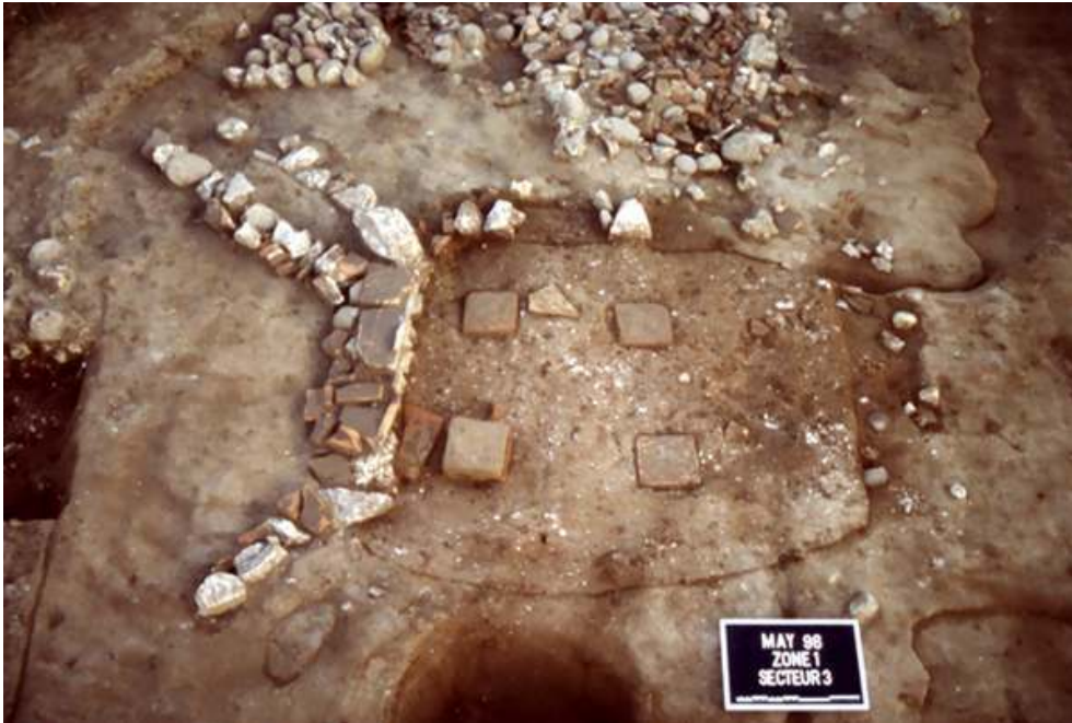
Fig. n°3 : Hypocauste dégagé au sud du chantier

Auteur(s) : Buffat, Loïc. Crédits : ADLFI (2004)