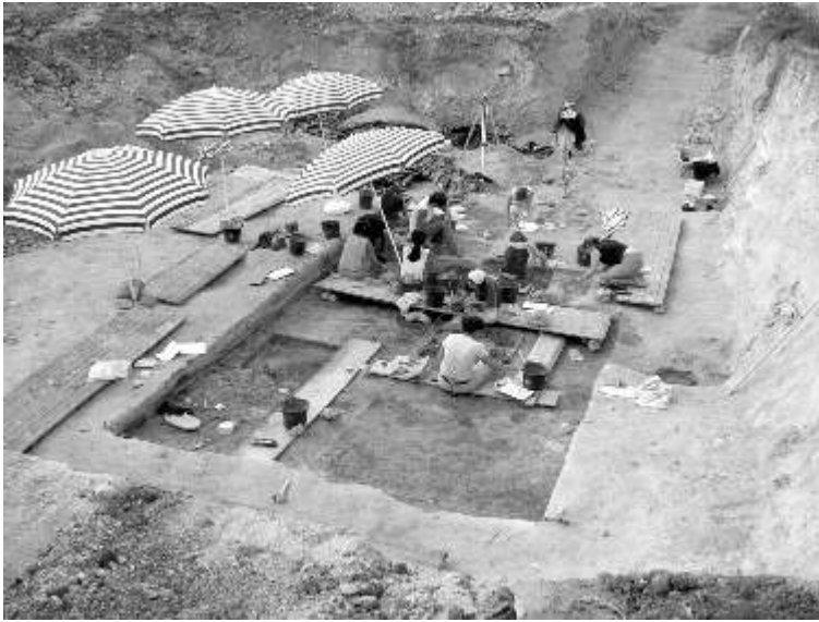
Fig. n°2 : Caours. « Les Près ». Vue du Secteur 2

Auteur(s) : LOCHT, Jean-Luc (INRAP). (2006)