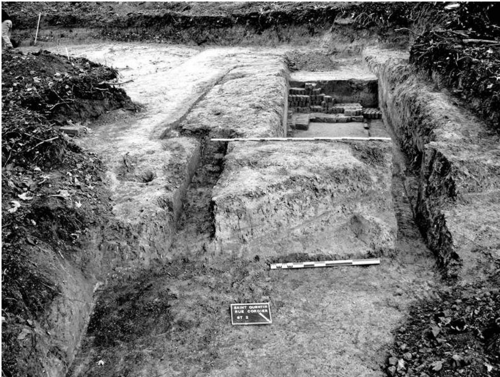
Auteur(s) : Hosdez, Christophe (INRAP). Crédits : Hosdez Christophe INRAP (2007)