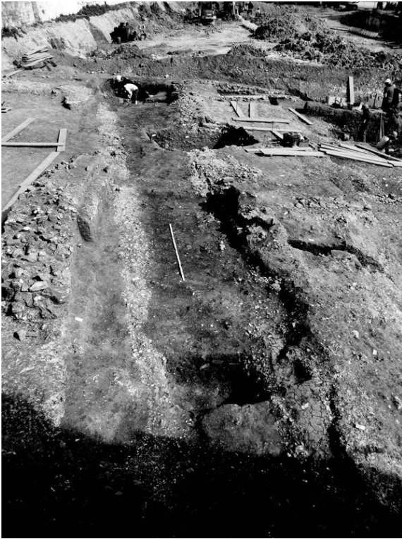
Fig. n°1 : Vue du caniveau au centre de la photo