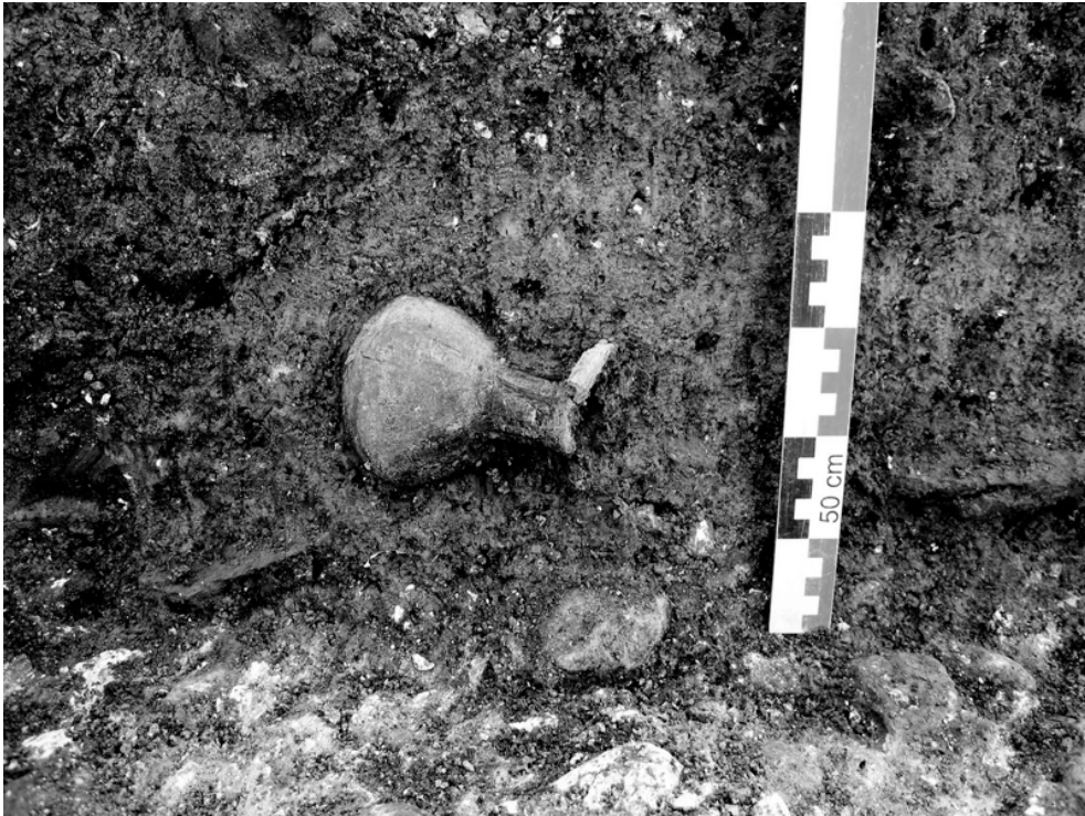
Fig. n°2 : Vue d'une céramique dans le comblement du caniveau

Auteur(s) : Lefèvre, Sébastien (SAM de Beauvais). Crédits : Lefèvre, Sébastien, SAM de Beauvais (2007)