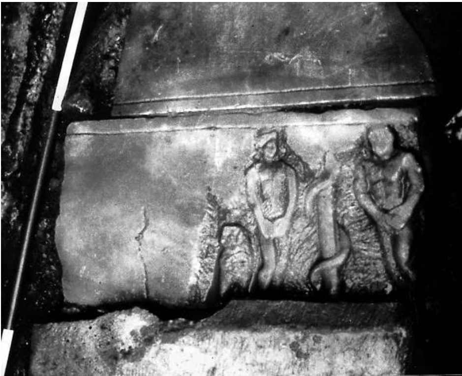
Fig. n°1 : Paroi de cuve de sarcophage paléochrétien ébauchée, remployée en couverture d'une tombe du XII es .

Auteur(s) : Dieulafait, Christine. Crédits : Gi 1997 ; CNRS Éditions (1988)