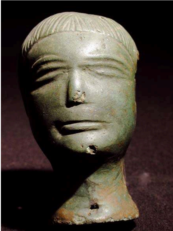
Fig. n°2 : Digulleville : statuette en bronze gallo-romaine