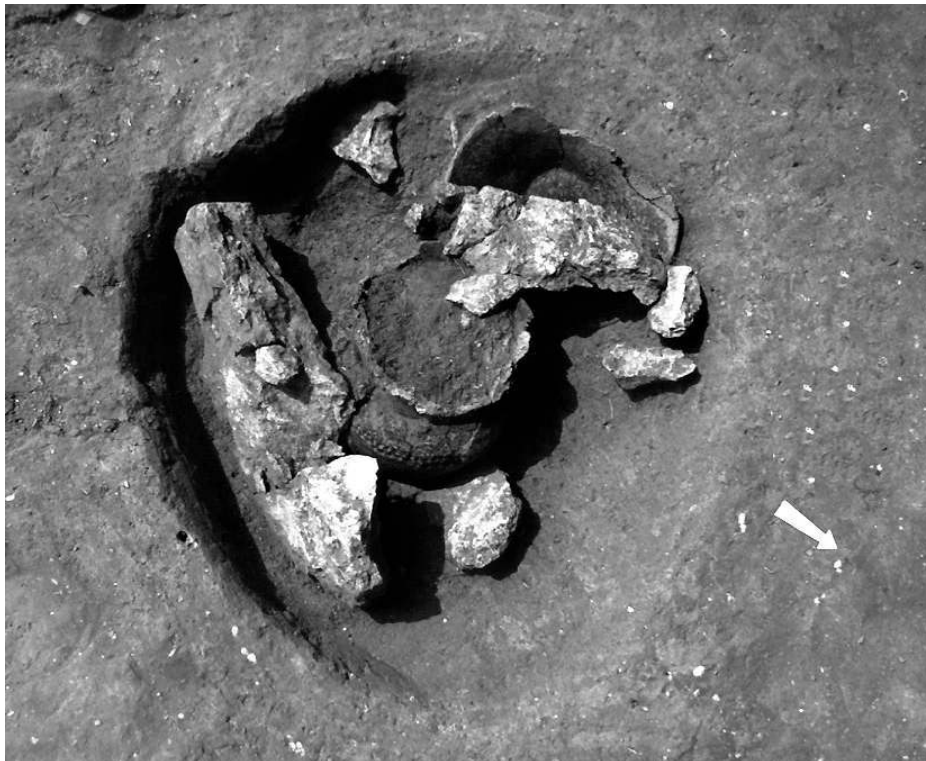
Fig. n°2 : Sépulture de la transition Bronze-Fer.

Auteur(s) : Janin, Thierry. Crédits : ADLFI (2004)