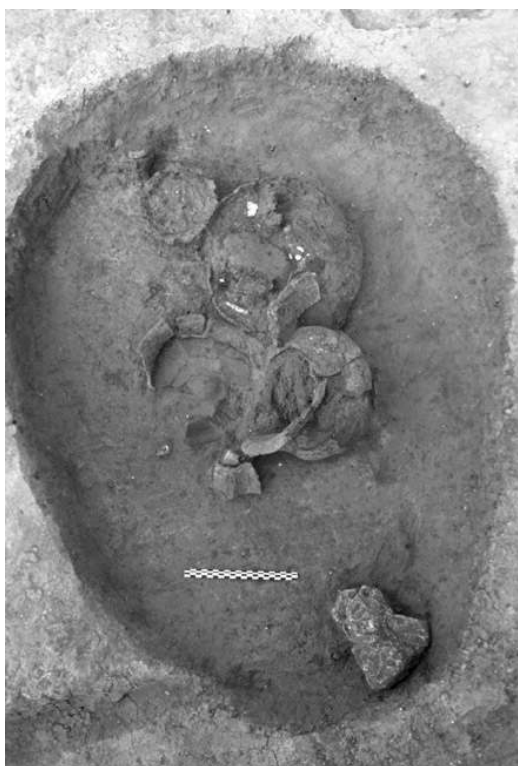
Fig. n°3 : Sépulture du début de l'âge du Fer.

Auteur(s) : Janin, Thierry. Crédits : ADLFI (2004)