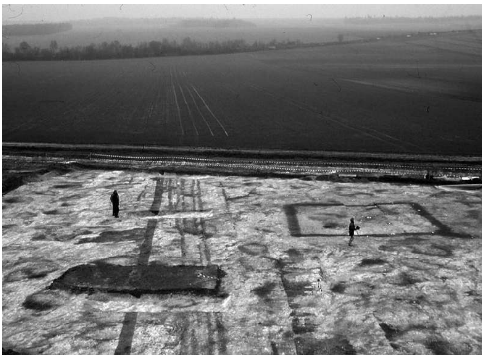
Fig. n°2 : Vue vers le site du chemin contemporain et de l'enclos funéraire laténien