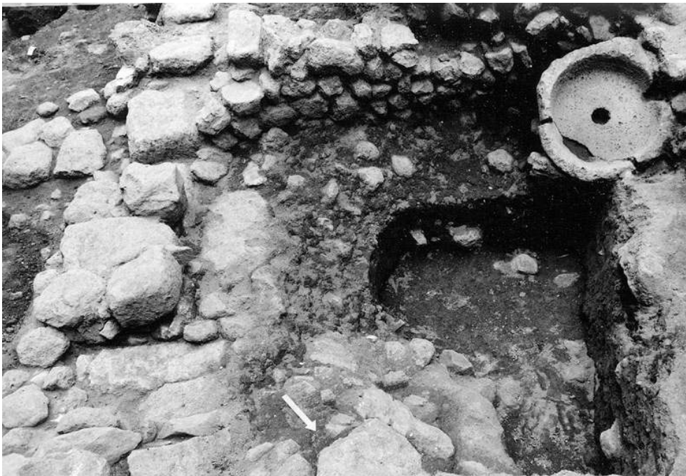
Auteur(s) : Ugolini, Daniela. Crédits : ADLFI - Ugolini, Daniela (2004)