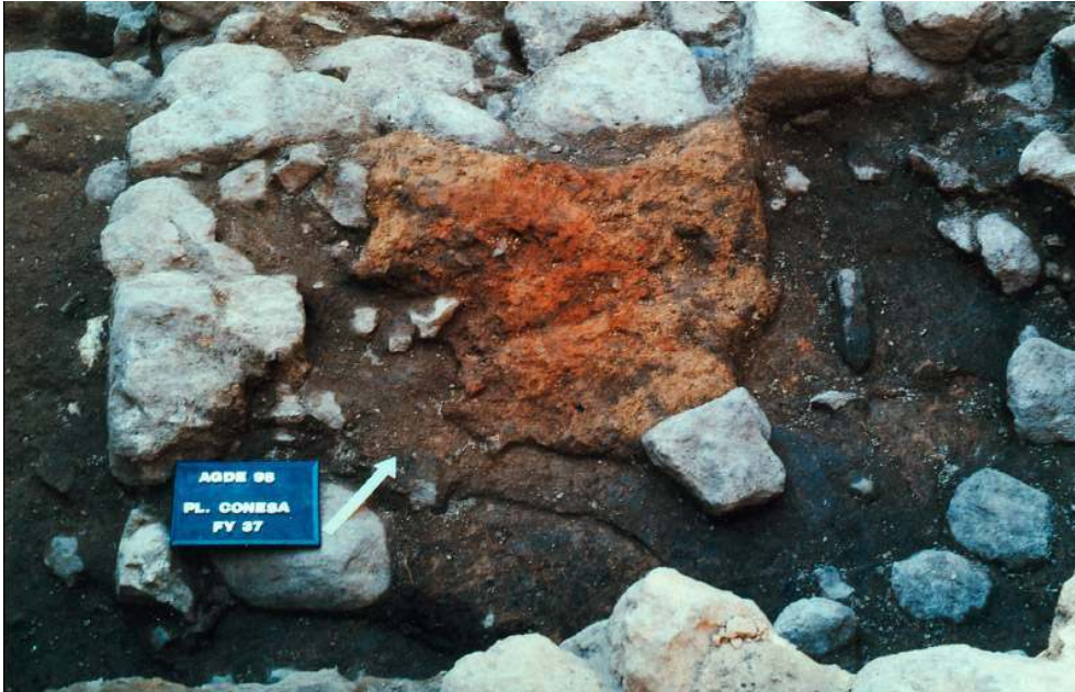
Auteur(s) : Ugolini, Daniela. Crédits : ADLFI - Ugolini, Daniela (2004)