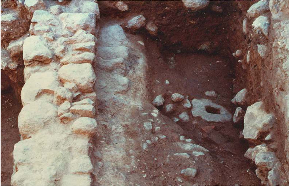
Fig. n°8 : Avant la construction de la maison, cette zone est inhabitée mais sert pour l'exploitation de l'argile provenant de la fonte des élévations en adobes de la phase grecque. Ici, une fosse en cours de fouille

Auteur(s) : Ugolini, Daniela. Crédits : ADLFI - Ugolini, Daniela (2004)