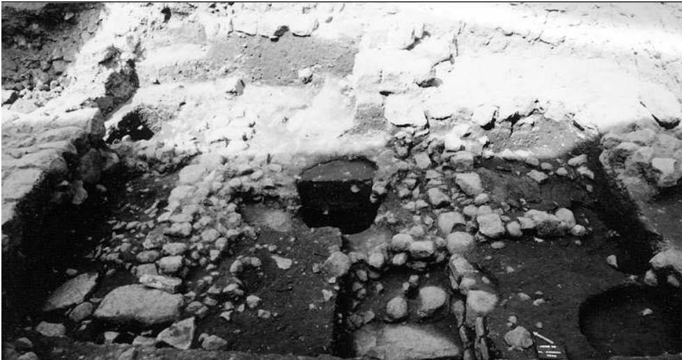
Fig. n°5 : Vue de l'abandon/démolition des niveaux de l'Antiquité tardive (VI e s.). Au centre un espace ouvert (cour), sur les côtés et à l'arrière, plusieurs pièces appartenant au même ensemble

Auteur(s) : Ugolini, Daniela.