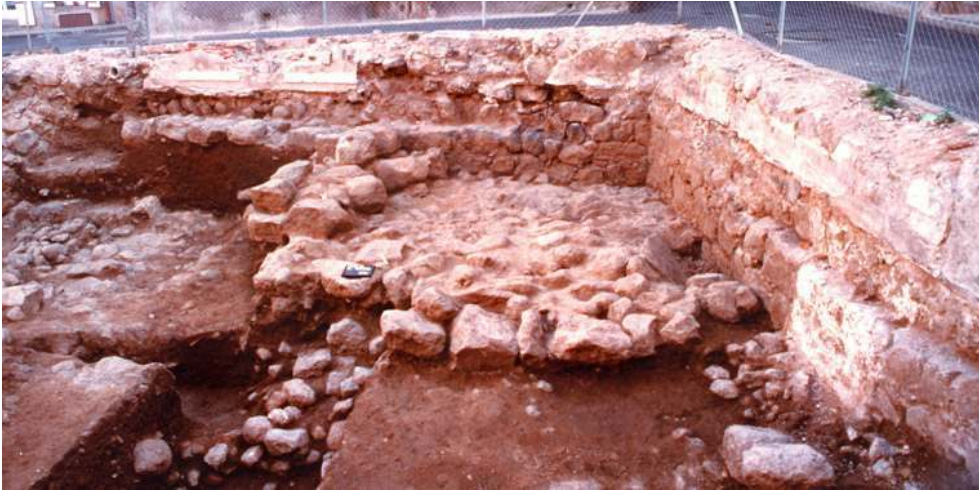
Fig. n°2 : Hérissure de sol d'un bâtiment du Moyen Âge (XII e s. - XIII e s.) situé dans l'angle sud-est de la place. La puissance de cet aménagement qui se trouve sous un premier hérissure de même nature, laisse supposer la présence d'une machinerie lourde (pressoir ?)

Auteur(s) : Ugolini, Daniela. Crédits : ADLFI - Ugolini, Daniela (2004)