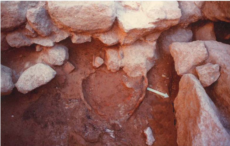
Fig. n°9 : Petit dolium contre le mur de façade de l'édifice grec (deuxième état), pris dans les niveaux de l'abandon de cette phase

Auteur(s) : Ugolini, Daniela.