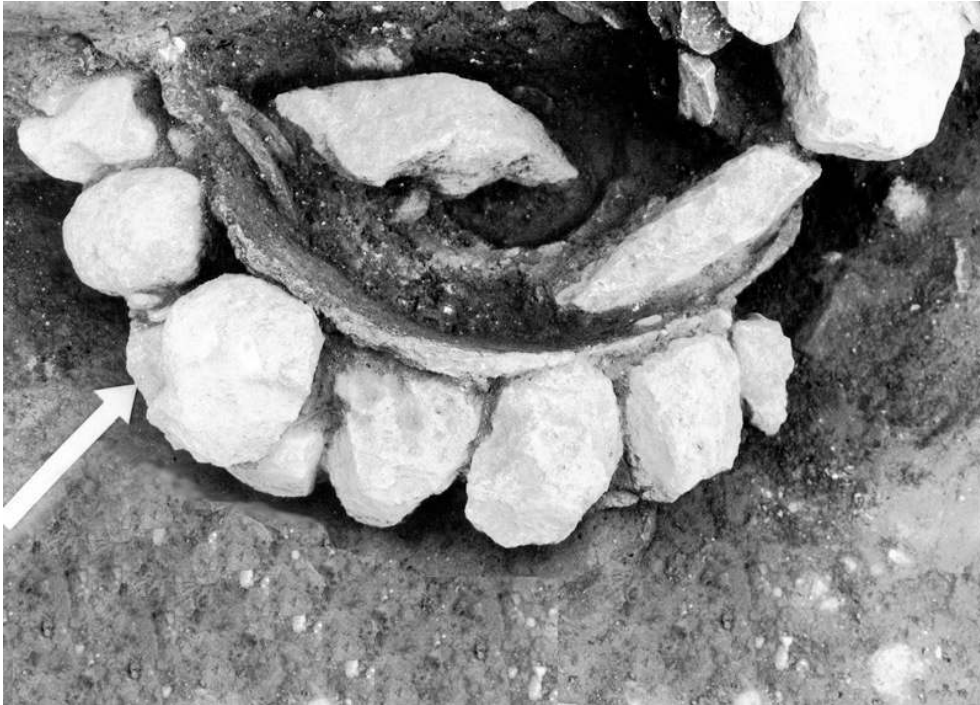
Auteur(s) : Ugolini, Daniela.