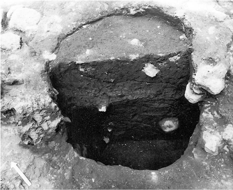
Fig. n°4 : Silo médiéval (X e s. - XII e s.)

Auteur(s) : Ugolini, Daniela.