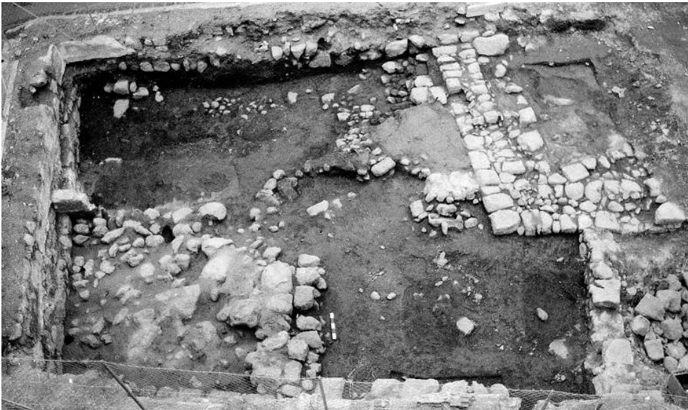
Fig. n°3 : Vue générale des niveaux médiévaux. En bas et à gauche, la pièce dont le hérissure de préparation du sol est présenté à la fig. 2. En haut et au centre, l'espace caladé (cour ?) et, à sa droite, les restes d'un escalier donnant accès à un bâtiment de grande taille matérialisé par le grand mur sur la droite. Accolée à ce mur, on distingue une construction en demi-cercle de fonction indéterminée