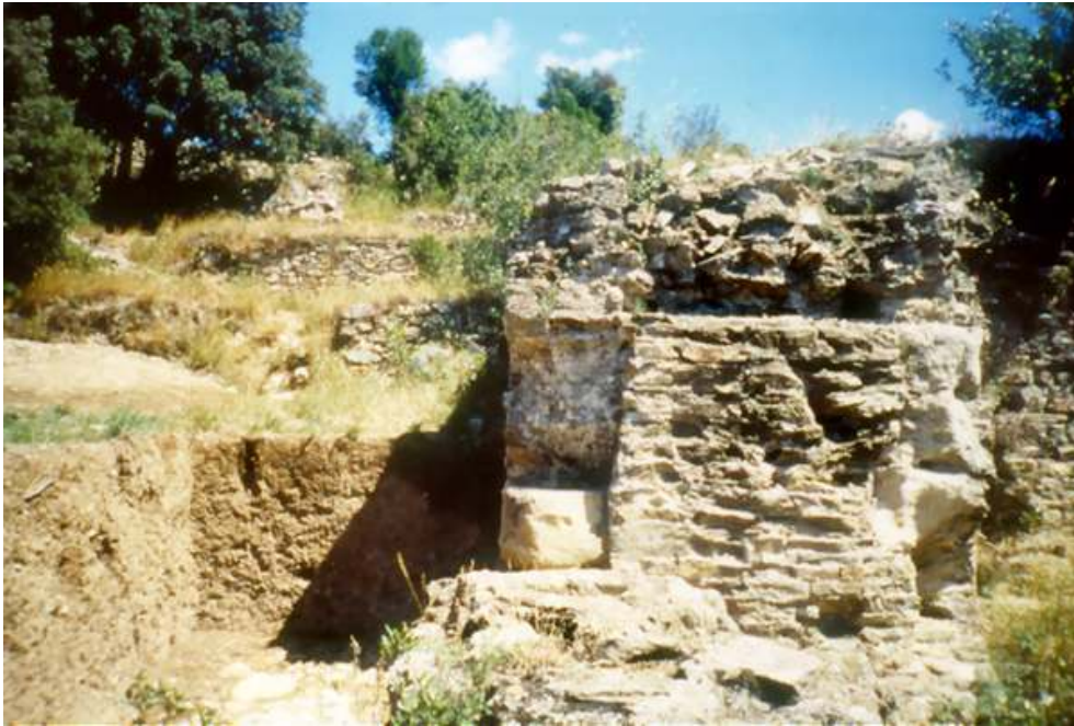
Fig. n°4 : Poterne de la face sud du fort romain (Cluses (Les), la Cluse Haute)