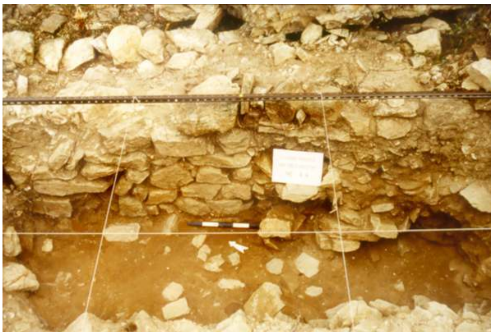
Fig. n°3 : Mur médiéval arasé et comblement XVe s. (Cluses (Les), la Cluse Haute)