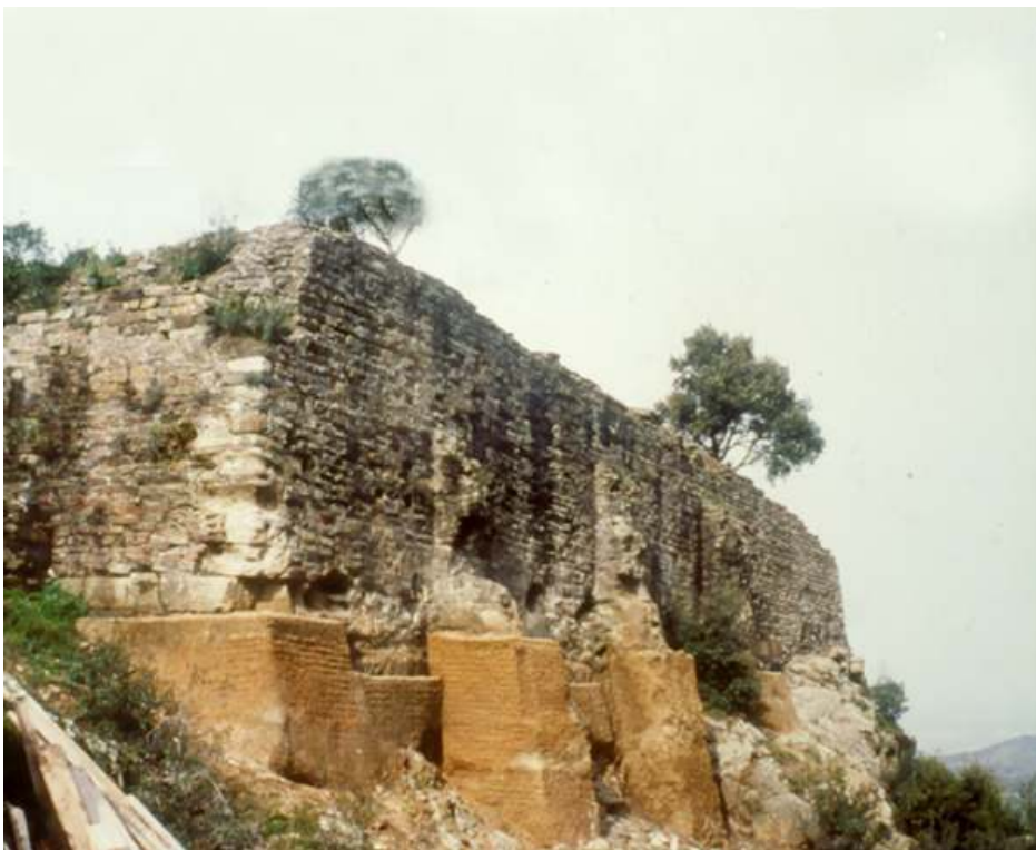
Fig. n°1 : Face est du fort romain (Cluses (Les), la Cluse Haute)

Auteur(s) : Castellvi, Georges. Crédits : ADLFI - Castellvi, Georges (2004)