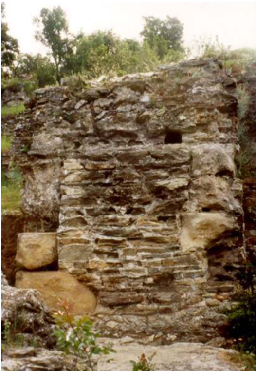
Fig. n°5 : Poterne. Blocs de grès en remploi en chaînages d'angles (Cluses (Les), la Cluse Haute)

Auteur(s) : Castellvi, Georges. Crédits : ADLFI - Castellvi, Georges (2004)