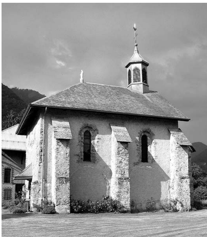
Fig. n°2 : Ancienne chapelle de Flérier