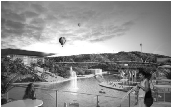
Figure 6. Méga-événement et utopie urbaine, São Paulo Expo©, avec l'aimable autorisation du BIE et de SPE.