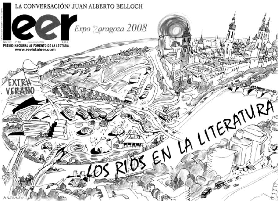
Figure 2. Méga-événement et nouvelle vision de la ville, 2008, Leer couverture, avec l'aimable autorisation du groupe de presse.

Dans l'exemple de Saragosse 2008, il se produit une re-création du monde urbain par un message utopique proposant par les interfaces naturelles de façonner des espaces éphémères permettant aux individus d'habiter le site de l'exposition, mais aussi de séjourner deux ou trois jours dans la ville hôte pour découvrir et comparer les nouvelles œuvres architecturales s'incorporant au patrimoine de la ville (Figure 2), tout en participant à la diffusion d'une image positive à travers la littérature par exemple.