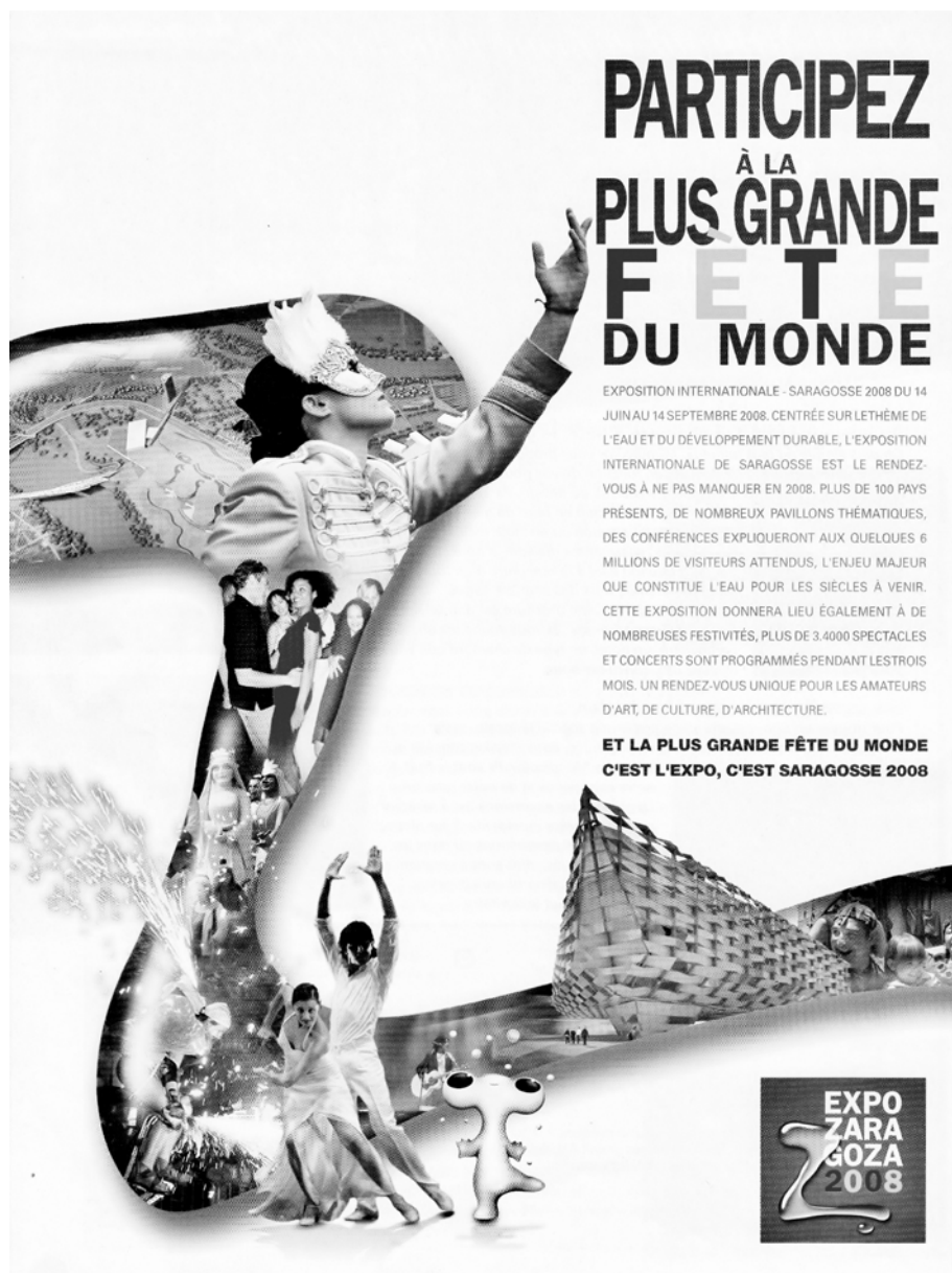
Figure 1. Saragosse Expo Agua 2008: le résumé d'une société d'exposition.