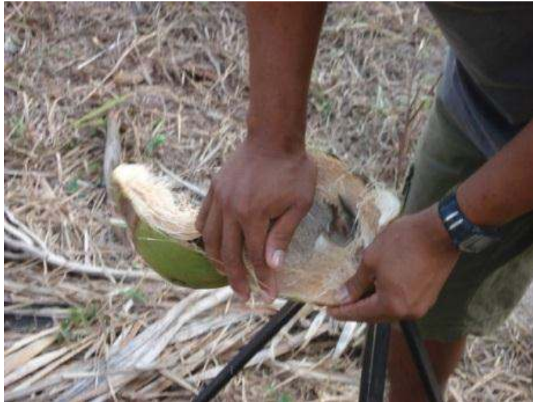
FIGURA II - Postura na função de descascador, detalhe da ferramenta de trabalho

de deslocamento lateral do coco em torno da lâmina, para esgarçar sua casca. Esse movimento é repetido 3-4 vezes por coco, com auxílio final apenas das mãos.