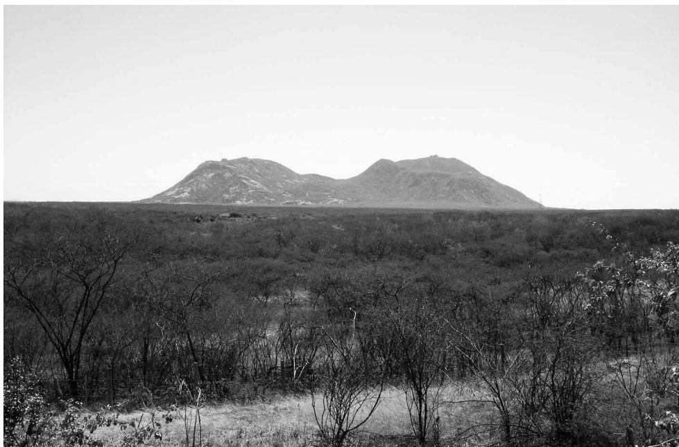
Photo 1 : Aperçu de la caatinga au milieu de la saison sèche dans le nord-ouest de l'État du Ceará/ Overview of the "caatinga" vegetation in the middle of the dry season in the north-west of Ceará

À l'arrière-plan, l'imposant relief résiduel de la Serra da Barriga, au-dessus de la plaine semi-aride du Sertão. Photo : F. Bétard, juillet 2005.