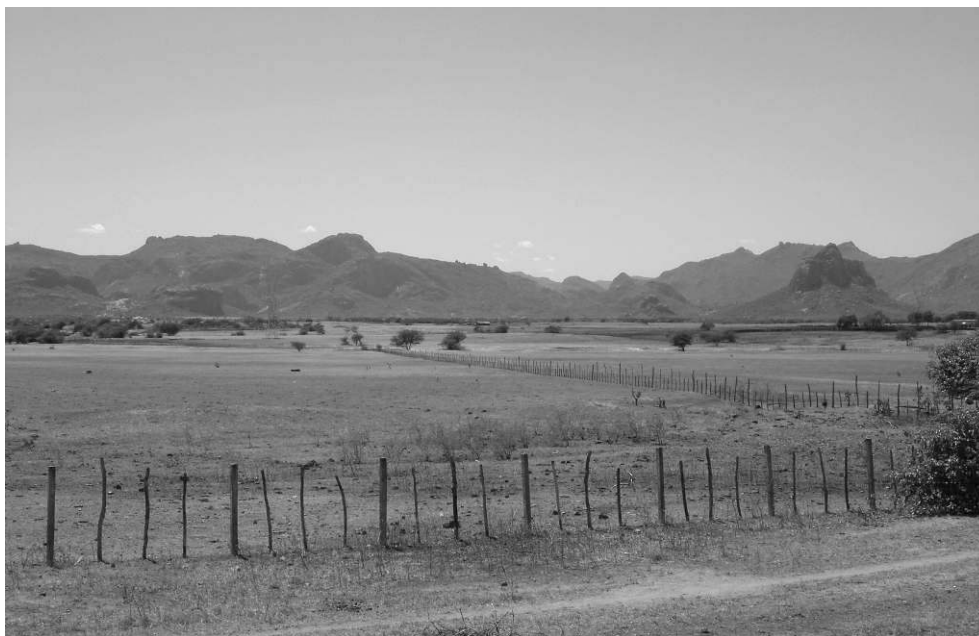
Photo 2 : Processus de désertification dans la région d'Irauçuba, dans le nord de l'État du Ceará/ Desertification processes in the Irauçuba region, in northern Ceará

La caatinga a laissé place à de grandes étendues de sols nus, conséquence directe du surpâturage par le bétail. À l'arrière-plan, l'escarpement montagneux du massif granitique d'Uruburetama. Photo : F. Bétard, juillet 2005.