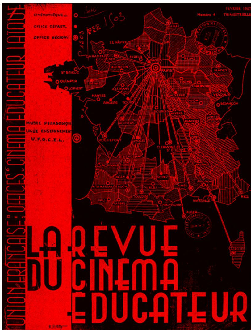
Couverture de la Revue du cinéma éducateur , n°4, février 1937.