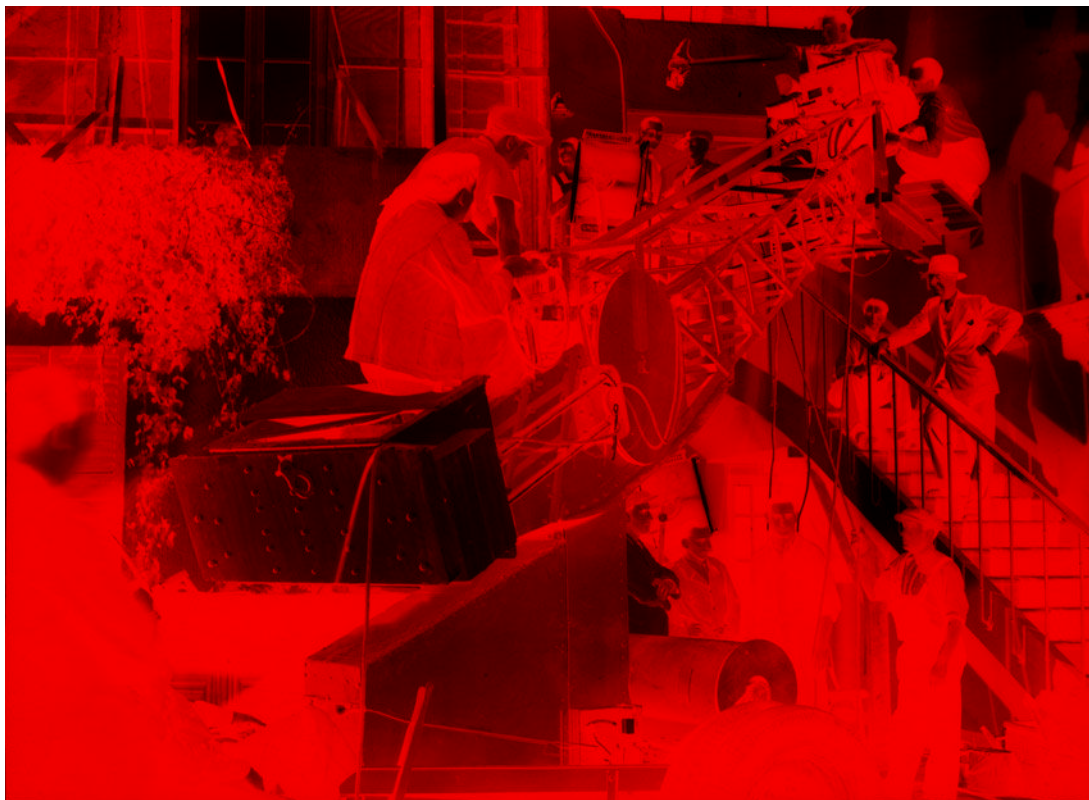
Tournage de Pension Mimosas de Jacques Feyder, 1934 – ingénieur du son : Hermann Storr. La caméra blimpée est située en haut de la grue.

partir de 1931 ( Jean de la lune, le Rosier de madame Husson, Knock... ), puis chef monteur des actualités Éclair-Journal, avant de revenir au long métrage, a d'abord été ingénieur du son pour les Films Sonores Tobis 17 . Si son nom n'apparaît dans aucun générique de 1929 à 1931, c'est qu'ils sont nombreux à travailler dans l'ombre pour cette grande compagnie qui a donc formé une pléthore de techniciens français. À l'époque les noms des opérateurs du son n'apparaissent pas dans tous les génériques.