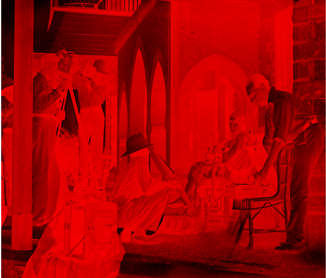
Tournage muet de L'Eau du Nil (son postsynchronisé) de Marcel Vandal, 1928.

comprennent qu'il s'agit de faire face à la concurrence américaine, puis allemande et anglaise, et de changer de méthode 13 . Fin 1929, les principales maisons de productions (Gaumont devenu GFFA, Pathé qui s'appelle Pathé-Natan) et de plus petites comme Jacques Haïk ou Braunberger-Richebé s'équipent ou font tourner leurs films parlants dans les studios anglais. Les ingénieurs du son qui enregistrent les voix françaises de ces longs métrages sont pour la plupart des étrangers : américains, allemands ou anglais. Ce sont eux qui forment les techniciens sur les plateaux français.