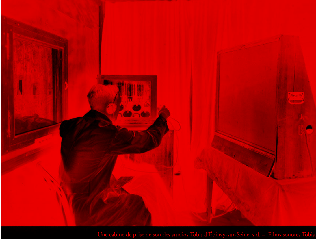
Une cabine de prise de son des studios Tobis d'Épinay-sur-Seine, s.d.