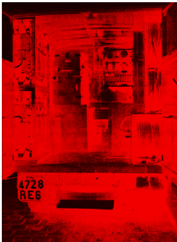
Vue intérieure d'un camion d'enregistrement – système «Radio-Cinéma».