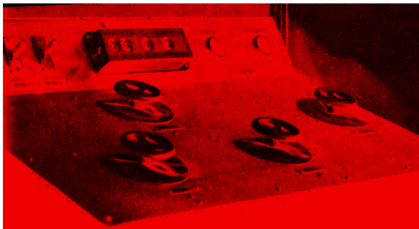
Vue d'ensemble d'un mélangeur de sons «Radio-Cinéma».