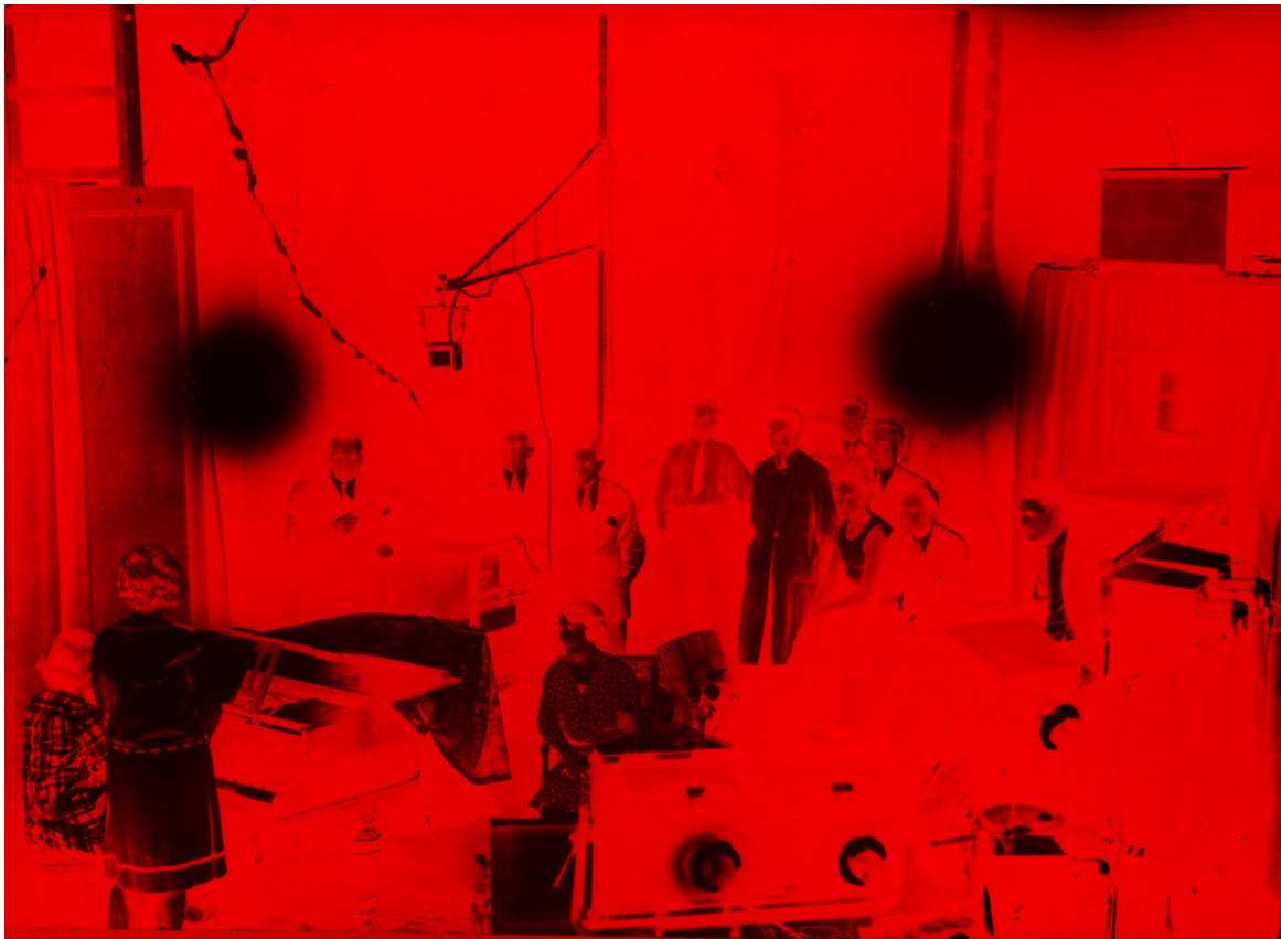
Le studio Gaumont en 1928, équipé du procédé Gaumont-Perteresen-Poulsen La caméra doit être à droite dans la cabine insonorisée par des rideaux.