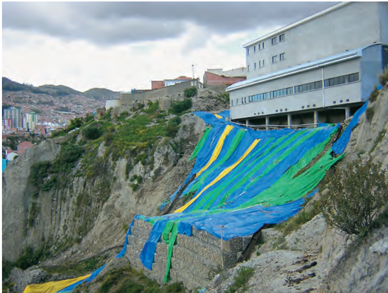
Figura 2 – Un complejo deportivo municipal se inauguró en 2006 en el macrodistrito San Antonio. Simboliza la decisión municipal de invertir en obras de infraestructura destinadas a volver atractiva a La Paz. Construido sobre un terreno inestable con fuerte declive, se dañó muy rápidamente, obligando a los gestores, para protegerlo de las amenazas, a construir obras defensivas cuyo costo ha sido más elevado que el del propio complejo

En efecto, al optar por construir colectores para evacuar las aguas de los torrentes, la municipalidad escapa parcialmente a las restricciones que establecen sus propias