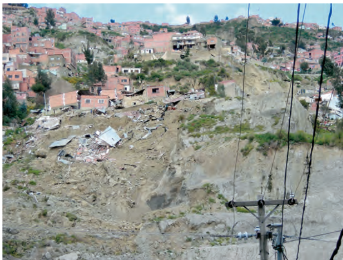
Figura 4 – El deslizamiento de tierra del barrio Retamani, Villa San Antonio, febrero de 2009, desencadenado por infiltración de aguas servidas en terrenos deleznable