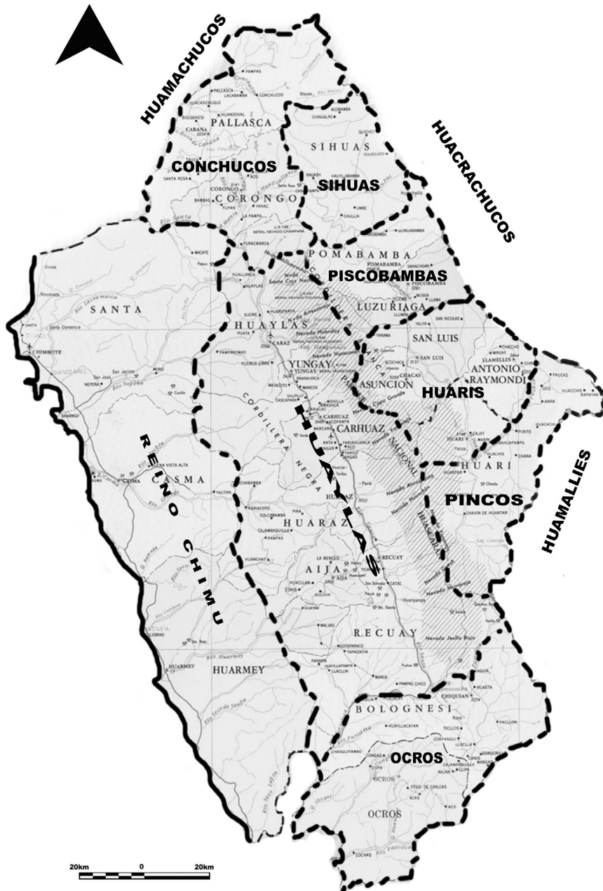
Figura 3 – Mapa de las provincias de Ancash y grupos étnicos al tiempo de la conquista inca. Redibujado por Bebel Ibarra a partir del mapa físico-político del departamento de Ancash. Instituto Geográfico Nacional del Perú, 1992. Adaptado de Druc, 2005: figura 7