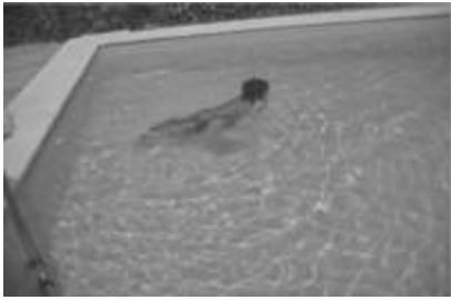
IMAGEN 13: MARCOS MOSTRANDO SU AUTONOMÍA EN EL MEDIO ACUÁTICO