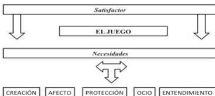
IMAGEN 6: ELABORACIÓN PROPIA

Intentando ordenar y sistematizar lo relatado, nos preguntamos: ¿qué hemos hecho hasta aquí?: