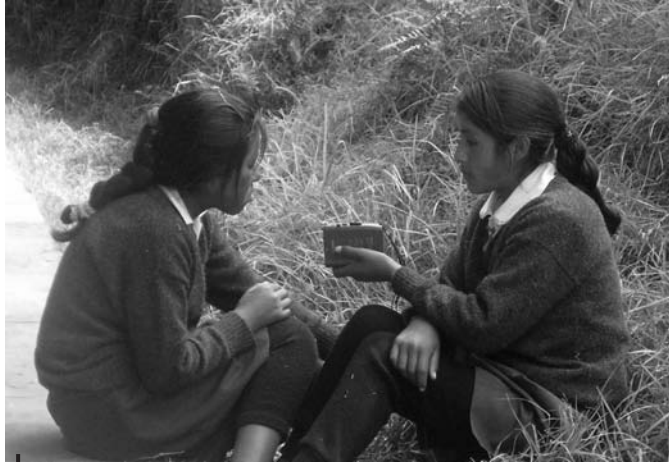
Figura 5 – Dialogismo en los Andes (comunidad de Ccachin, provincia de Calca)

La dimensión colectiva de la realización de las adivinanzas hace de estas un caso ejemplar del carácter dialógico de los actos narrativos quechua, subrayados por Mannheim & Van Vleet (2000) 15 . Efectivamente, las adivinanzas son esencialmente relatos dialogados, puesto que un niño propone un acertijo y los demás deben resolverlo.