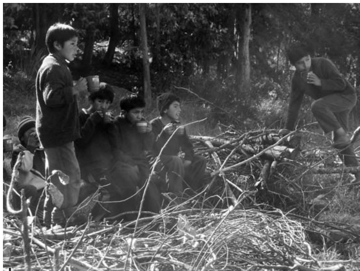
Figura 4 – Entre los los árboles (comunidad de Ccachin, provincia de Calca)