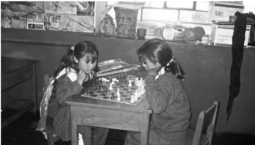
Figura 1 – Niñas jugando en la escuela (comunidad de Ccachin, provincia de Calca)

En lo que concierne las operaciones y competencias implícitas en la resolución y elaboración libre de las adivinanzas de las que hemos hablado más arriba, en este artículo nos contentamos con una aproximación sucinta de las mismas. Limitémonos a señalar que incluso a la edad de 5 años, los juegos de metáforas, de analogías y ambigüedad que entran en juego en las adivinanzas son bastante complejos y manifiestan una función poética innegable (Jakobson, 1963: 218) 7 que los niños dominan bastante bien.