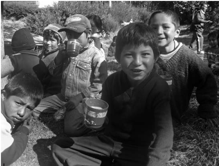
Figura 3 – La merienda (comunidad de Ccachin, provincia de Calca)

Eventos de habla 11 de un grupo bien definido (en nuestro caso el de 5 a 12 años), las adivinanzas juegan también un rol importante en el proceso de socialización, del desarrollo de la personalidad y de la identidad del niño 12 . En efecto, es sobre todo en su función de socialización que estos juegos de lenguaje —en el sentido que da la etnografía de la comunicación a este concepto (Hymes, 1964)— adquieren todo su valor. Tal como lo subraya Hymes (1964: 215), el evento comunicativo o eventos de habla ( speech event ) es un instrumento de construcción de la identidad. Digamos además, que si la performance de las adivinanzas constituye un elemento esencial de la construcción de la identidad individual, lo es también de la identidad colectiva. Virginia Zavala reporta que en la zona de Andahuaylas, la performance de adivinanzas funciona «como herramienta de competencia para que una persona pueda defender su identidad como miembro de una comunidad (Zavala, 2006: 134-135). Es así que gran parte del aprendizaje y descubrimientos cognitivos se operan mediante pares y mayores con quienes el niño interactúa en la comunidad.