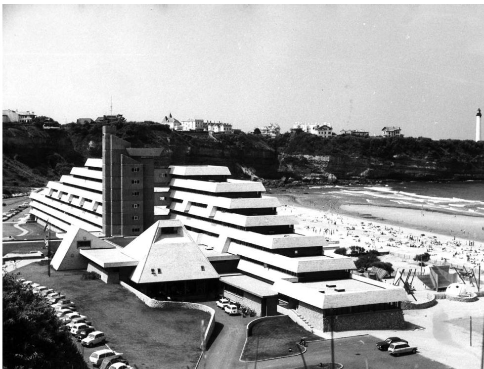
Anglet (Pyrénées-Atlantiques) : Village vacances famille (VVF), par Aquitaine architectes associés (dont Jean-Raphaël Hébrard et André Grésy), 1969, vue d'ensemble depuis la falaise. N.d., Siaf/Capa/ Archives d'architecture du xx e siècle, fonds DAU, 133 lfa 7/1.