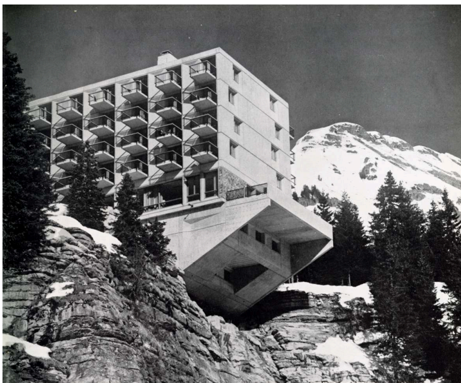
Arâches-la-Frasse (Haute-Savoie) : hôtel Le Flaine, par Marcel Breuer, 1966-1968. Extrait de Techniques et Architecture , 1969, n° 4.