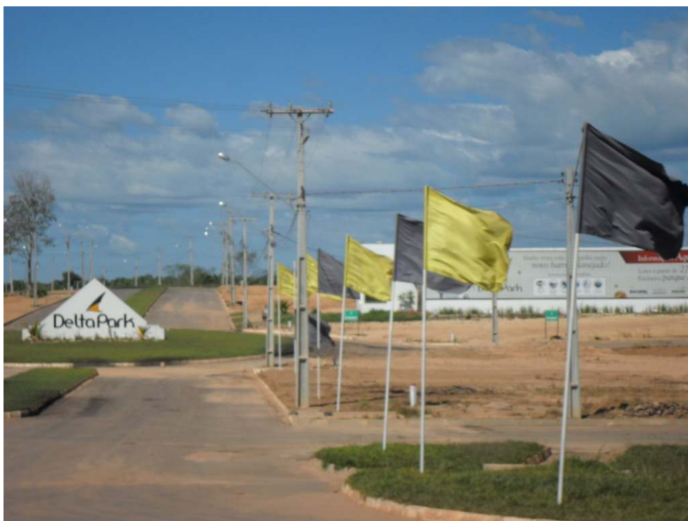
Imagem 3: Foto do Condomínio de alto padrão na Rodovia Transamazônica