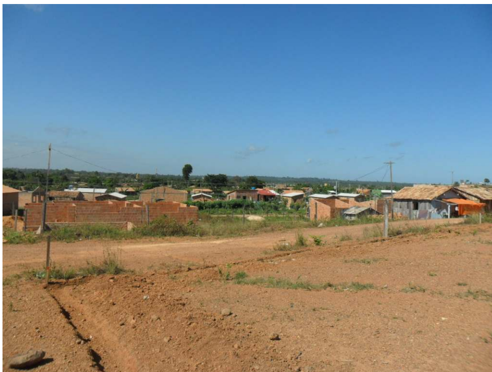
Imagem 4: Foto da área de ocupação (margem direita) na Rodovia Transamazônica