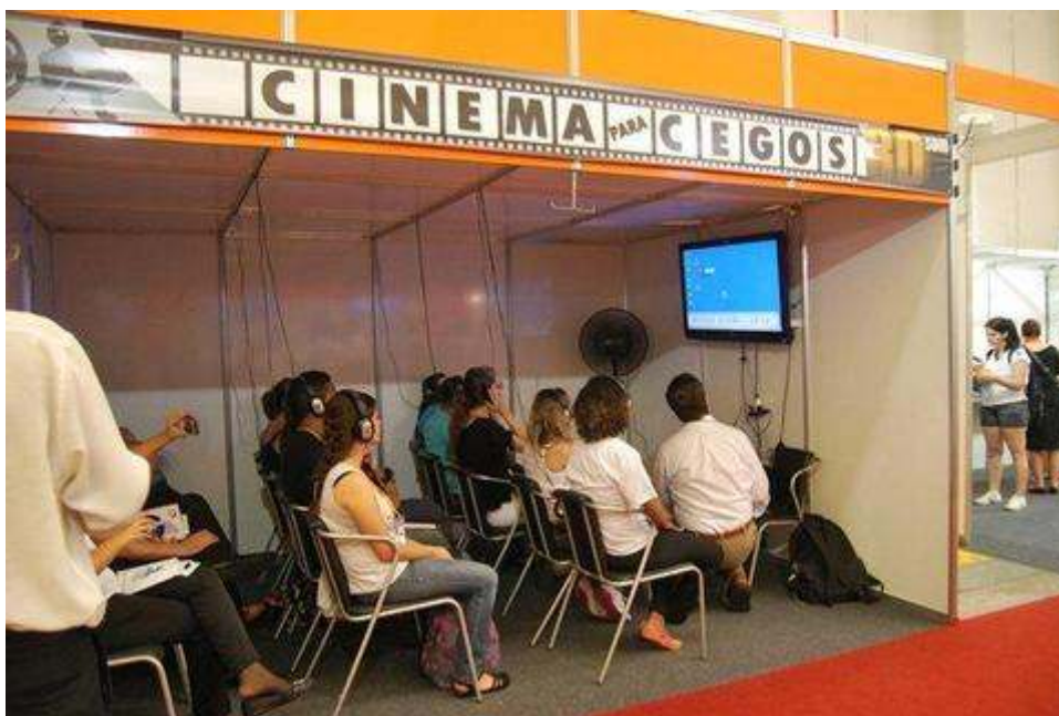
Figura 4: Cinema para cegos