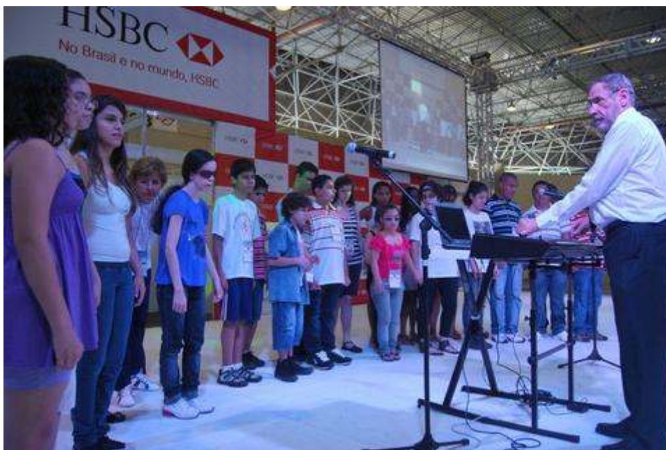
Figura 6: Coral de cegos