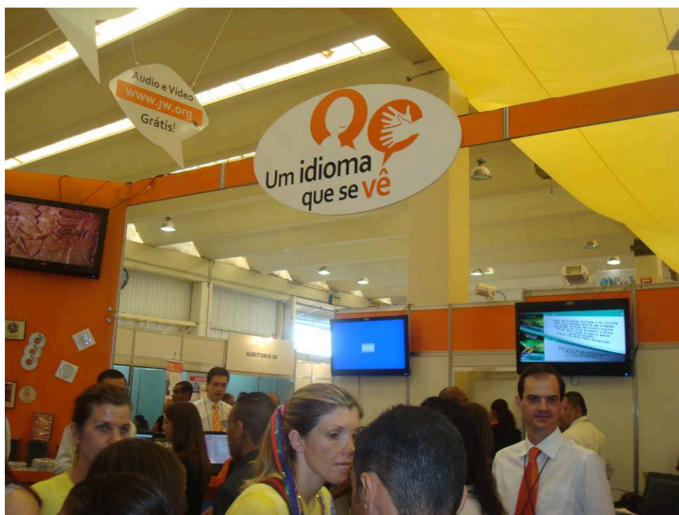
Figura 3: Um idioma que se vê