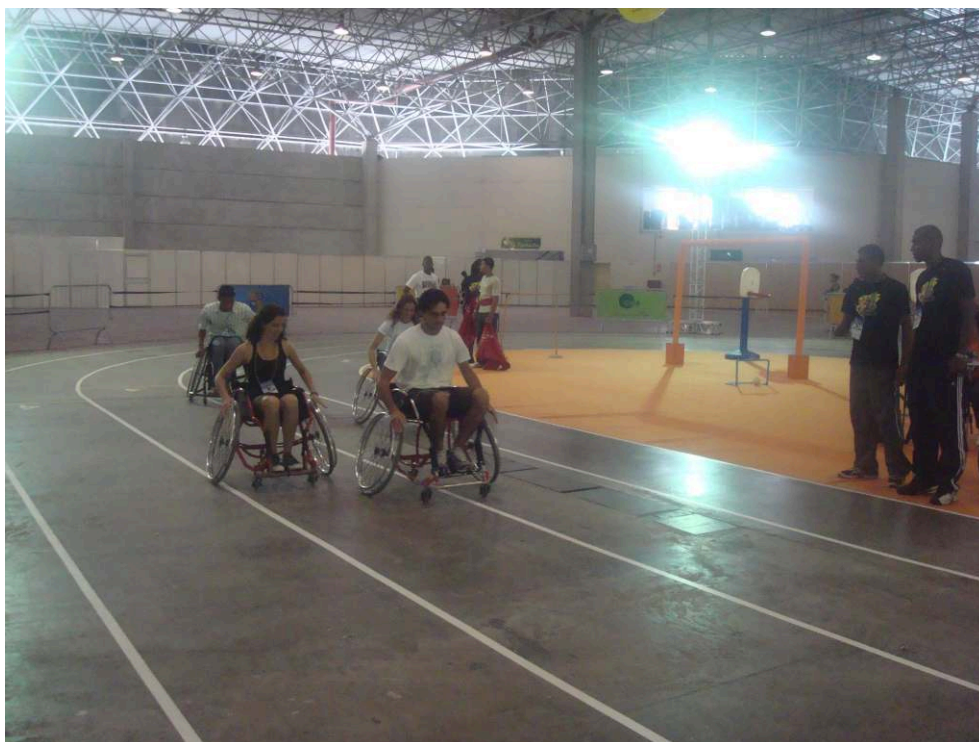
Figura 5: Corrida de cadeira de rodas