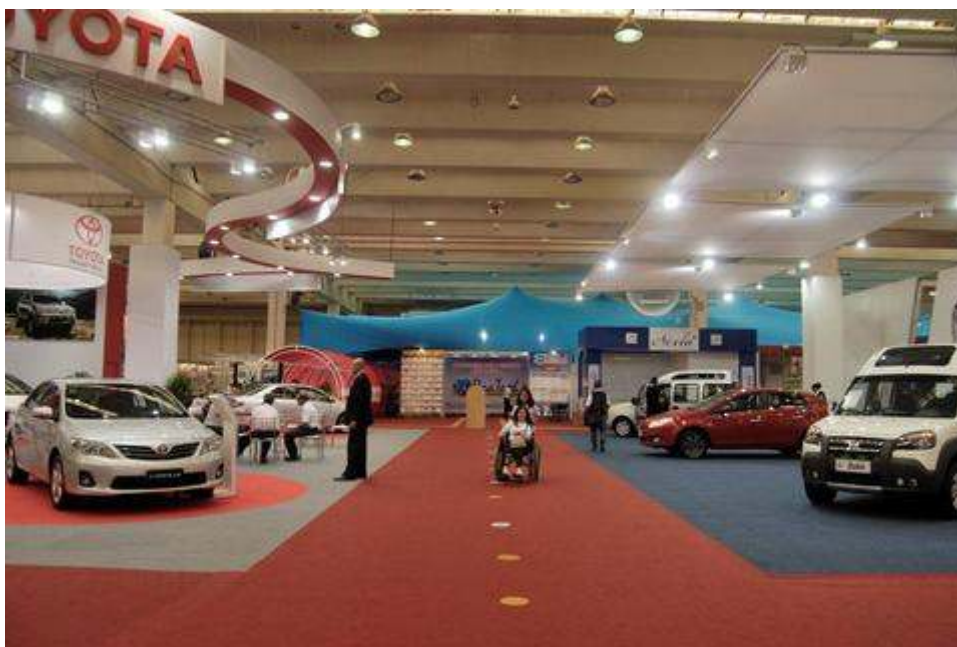
Figura 2: Estandes centrais

do centro de exposições, as montadoras presentes ofereciam a possibilidade de realizar teste drive em tais veículos adaptados.