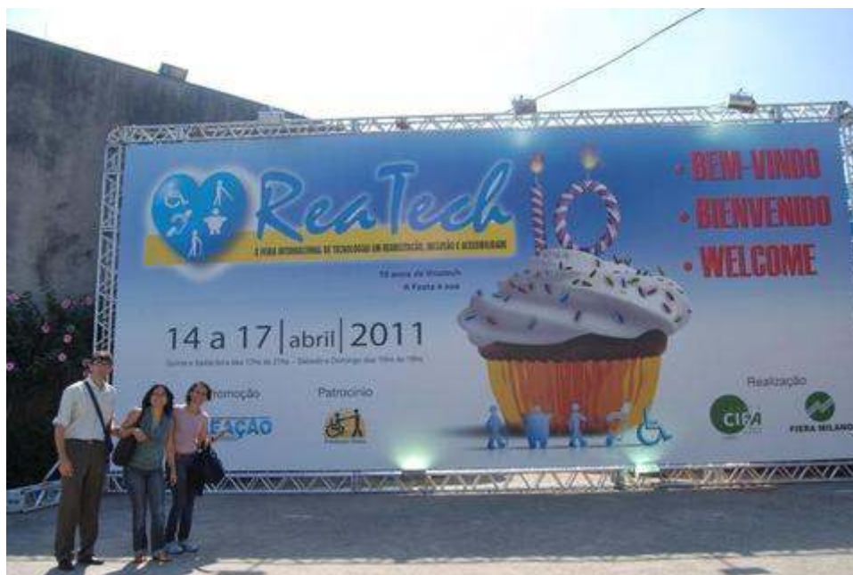
FIGURA 1: OUTDOOR DO EVENTO