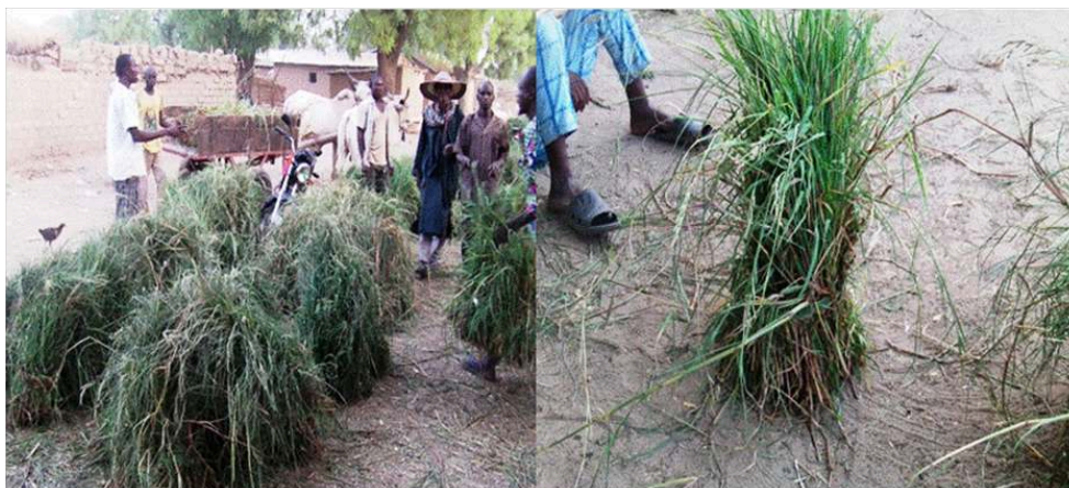
Figure 3. Gerbes et acteurs du marché de bourgou à Tin-Tin4.2.3. Institutionnalisation de l'exploitation de bourgoutière

d'eau potable dont le coût est estimé à cent mille francs (100.000 FCFA soit $ 200 US). Aussi envisagent-ils de contribuer à la création d'une école dans le village, pour faciliter la scolarisation des enfants qui doivent parcourir entre deux (02) et cinq (05) kilomètres pour rejoindre l'école la plus proche.