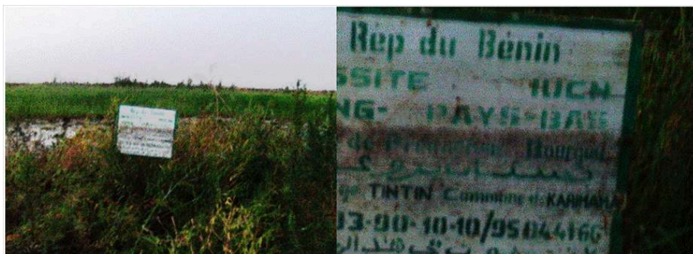
Figure 4. Plaque marquant la propriété dans la bourgoutière communautaire de Tin-Tin