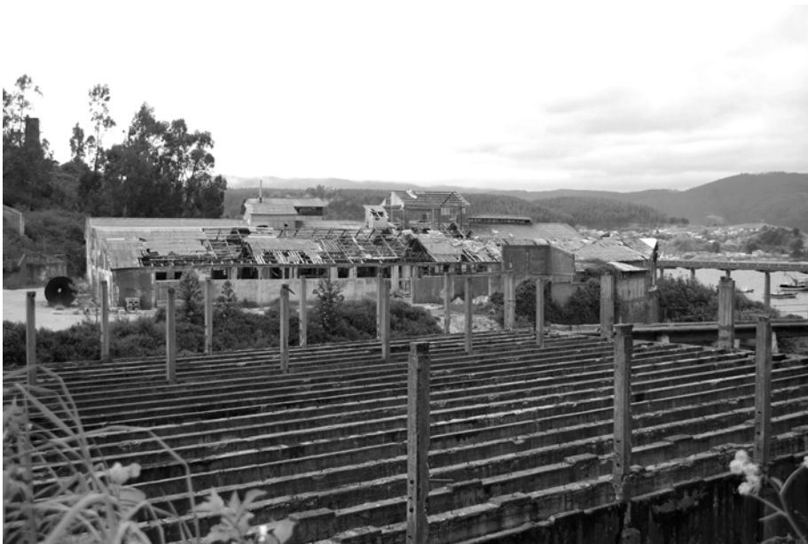
Figura 4. Ruinas del complejo industrial de Lota.

y sucumbe desde la perspectiva del cambio con el cierre de la mina como eje estructurante de la vida en común. Si existe dolor, es porque las transformaciones hacen desaparecer de la presencia del mundo todo cuanto no es actual, es decir, la obsolescencia de la experiencia y de las infraestructuras urbano industriales les arrebatan la historia, porque les impide recuperar el lugar en el mundo, ya que, por ejemplo desapareció el sindicato, aunque permanezcan muchas de sus sedes, y los partidos tienden a ser superados en su convocatoria por las iglesias evangélicas (Figura 4).