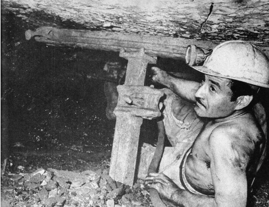
Figura 2. Trabajador al interior de la mina.

Desde una perspectiva etnográfica y etnológica, este modo de trabajar se constituye en una actividad tradicional, repetitiva, reconocida y sedimentada en el tiempo; la forma de trabajo con sus eternas rutinas y rituales, el riesgo al interior de la mina y el que no haya “en el mundo mayor silencio, a menos que lo interrumpa una gotera persistente, vil recordatorio de que el océano está encima” (Rivas, 2000, p. 6) es lo que hace que cada día se envejezca de manera acelerada y se muera un poco más en un trabajo que presenta históricamente pocas variaciones por los esfuerzos físicos comprometidos.