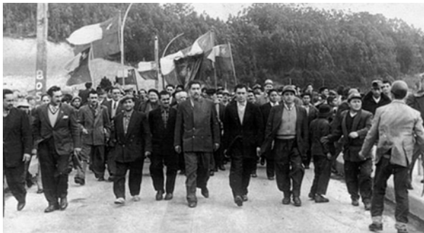
Figura 3. Mineros huelga larga, 1960.

Una década más tarde, bajo la presidencia de Salvador Allende, se promulgó la Ley No 17.450 del 16 de julio de 1971, que ordenaba la concentración y estatización de todas las explotaciones carboníferas, definiéndola como “dominio absoluto, exclusivo, inalienable e imprescriptible del Estado sobre todas las minas”. Para los trabajadores del carbón y la ciudad de Lota, ésta Ley se consideró el último gran gesto del Estado chileno con sus reivindicaciones (Figura 3).