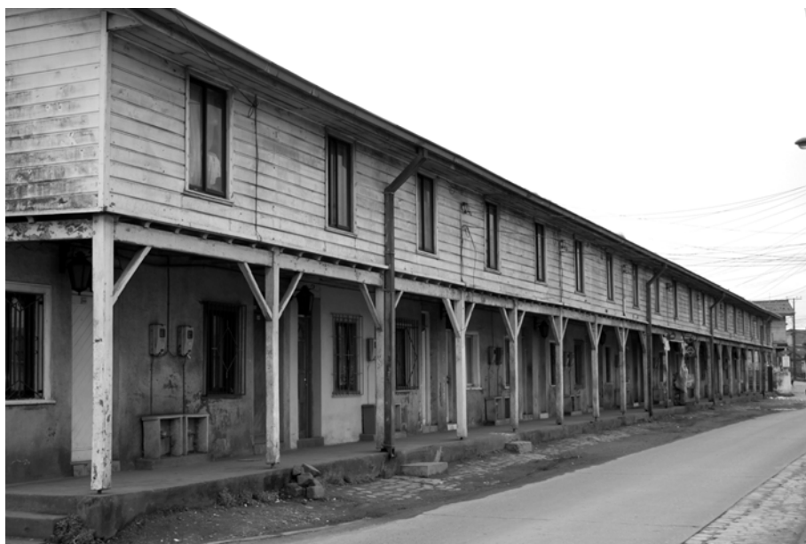
Figura 5. Pabellones habitacionales de los mineros.

La ciudad postcarbón es simultáneamente un laboratorio y un museo. Atestigua el fin de una historia, de una clase, de una identidad laboral, una pertenencia, una forma de hacer amistad, de hacer familia y de recreación, anunciando una nueva ciudad. Pero, su ruina revela siempre la actividad fundacional. Por eso en Lota hay ruinas y gente arruinada: la estructura de oportunidades –en lo personal y familiar– sufrió un cambio fundamental, que su herida está abierta, lo que se traduce en una importante e irónica presencia de “instituciones imaginarias”, como sedes de sindicatos y sindicalistas propios de un mundo anterior al cierre definitivo de las minas en el año 1997. Al romper el hombre de manera unilateral el pacto con la naturaleza (porque el carbón sigue existiendo), la ciudad habilitada con sus instalaciones para el trabajo productivo comienza a verse fantasmagórica, debilitada, vacía, deteriorada; se torna en un lugar de ausencias, en cuanto van transformándose en ruinas los vestigios de la arquitectura industrial: economato, teatro obrero, hospital, los pabellones de las viviendas, la cervecería, entre otros (Figura 5).