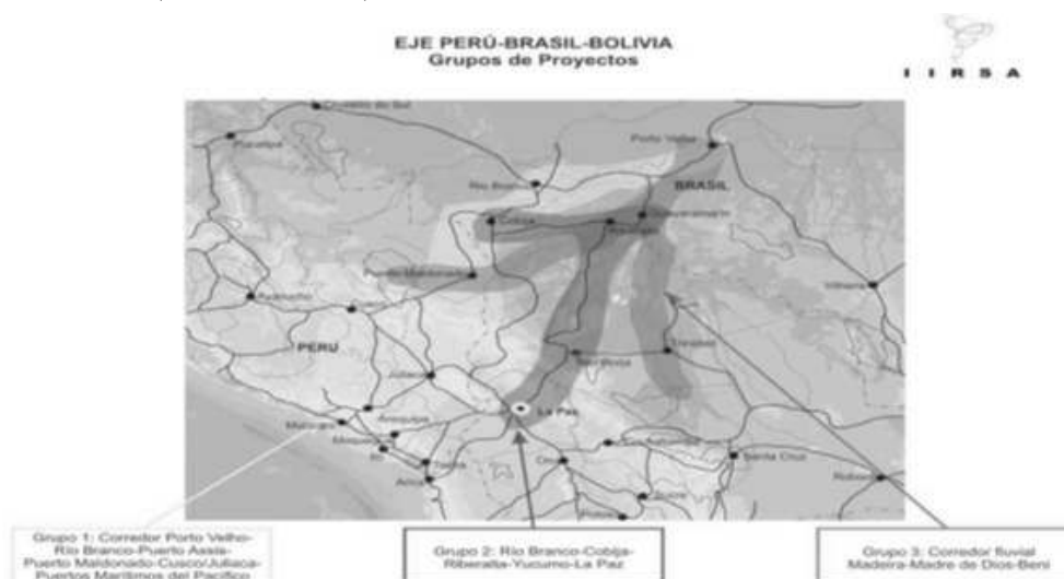
FIGURA 1. GRUPOS DE PROYECTOS DEL EJE PERÚ-BRASIL-BOLIVIA.