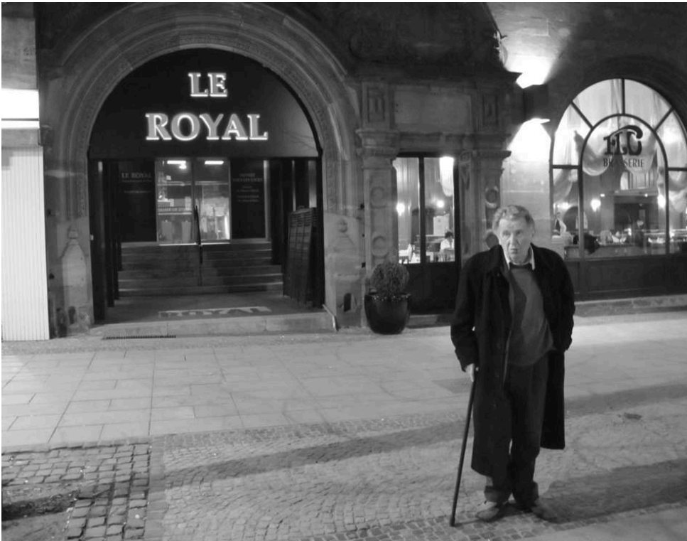
27 mars 2011 – Le cinéma Le Royal, rue Gambetta, dans lequel avaient lieu dans les années cinquante des séances de différents ciné-clubs messins dont La Chambre Noire. C'est là que Jean-Marie Straub et ses amis ont fait venir François Truffaut, André Bazin, Jacques Doniol-Valcroze, Henri Agel...