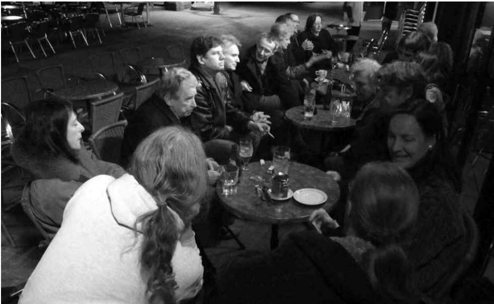
Après la projection, au Caméo, du Caporal épinglé de Jean Renoir, Jean-Marie Straub, entouré de spectateurs et d'amis, prend un verre à une terrasse de la Place Saint-Jacques – 22 mars 2011.