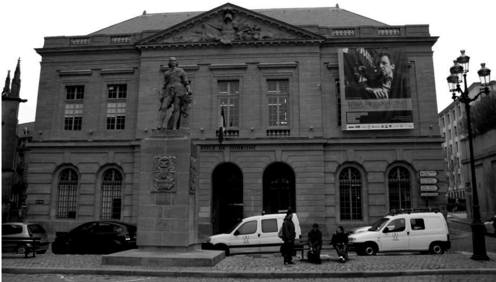
Place d'Armes, l'annonce de la rétrospective Straub-Huillet.