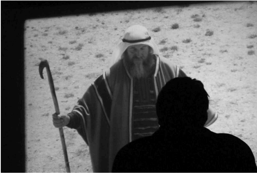
Avant la projection de Moïse et Aaron , Jean-Marie Straub, debout face à l'écran de l'Opéra-Théâtre, vérifie la qualité de l'image et du son.