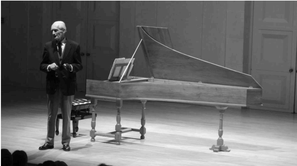
Concert de Gustav Leonhardt à l'Arsenal de Metz - 26 mars 2011.