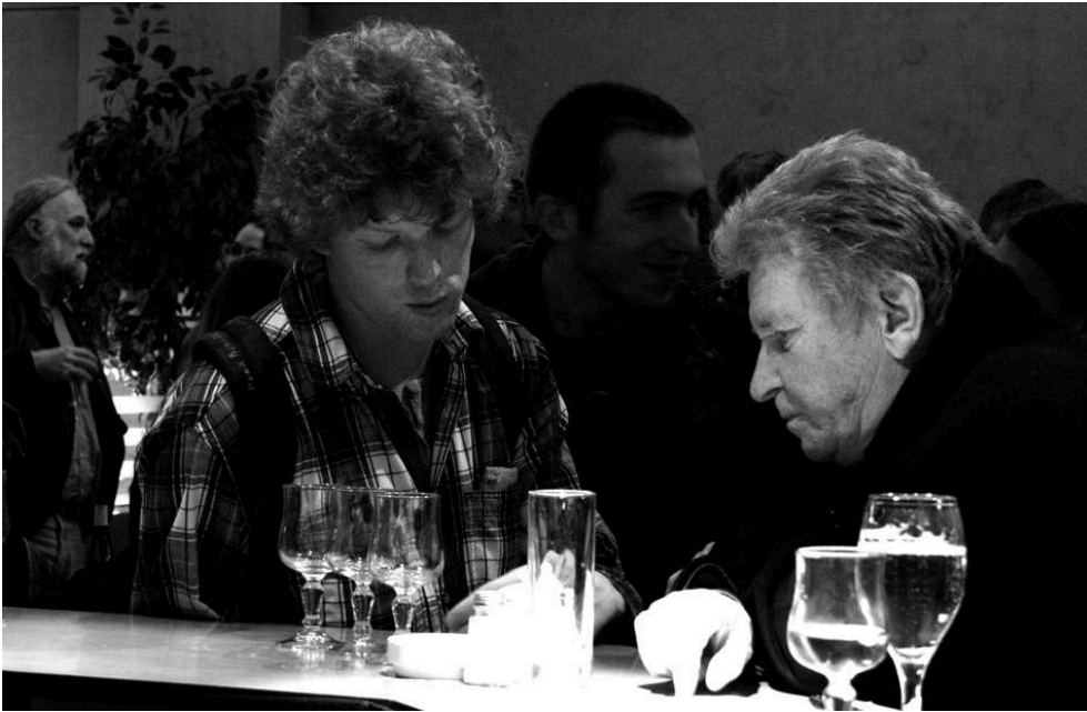
Ici, un étudiant de l'École Supérieure d'Art de Metz poursuit la discussion avec Jean-Marie Straub...