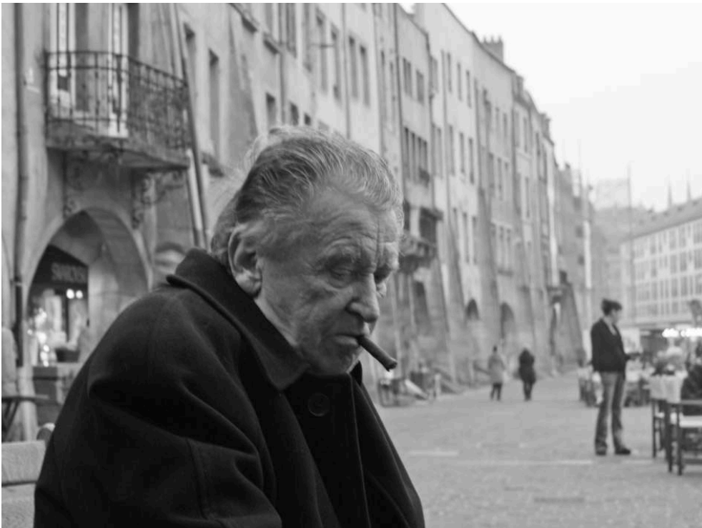
Jean-Marie Straub, place Saint-Louis à Metz – 26 mars 2011.