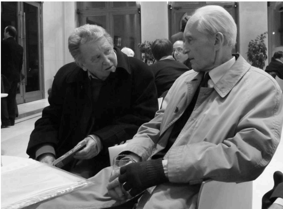
Jean-Marie Straub et Gustav Leonhardt se retrouvent après le concert.