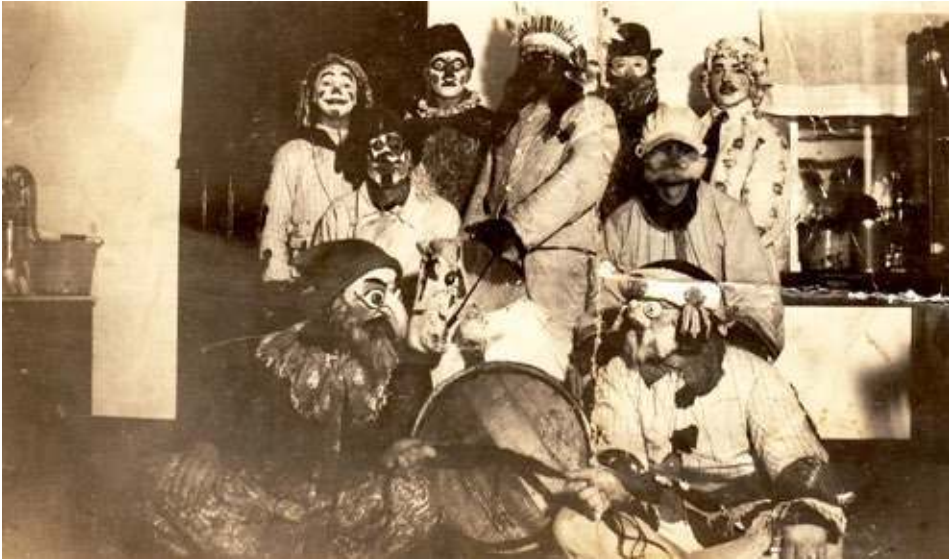
Fig. 3. Troupe de Brommtopp du District d'Amsterdam près de Rosenfeld, Manitoba, vers 1928.

manière dont les participants au Brommtopp historique revêtaient leurs déguisements (pour autant qu'ils l'aient jamais fait). Il n'existe aucune image du rituel en cours. Et, comme déjà mentionné, les témoins historiques n'ont pas voulu nous donner de précisions quant aux deux formes de travestissement. La coutume devient encore plus énigmatique dans la mesure où la chanson elle-même (traditionnellement chantée en allemand ou en bas-allemand) n'invite pas clairement à s'habiller en femme. Et que seul son dernier vers comporte une allusion apparemment ethnique («trois jeunes filles brun foncé s'enfuirent»).