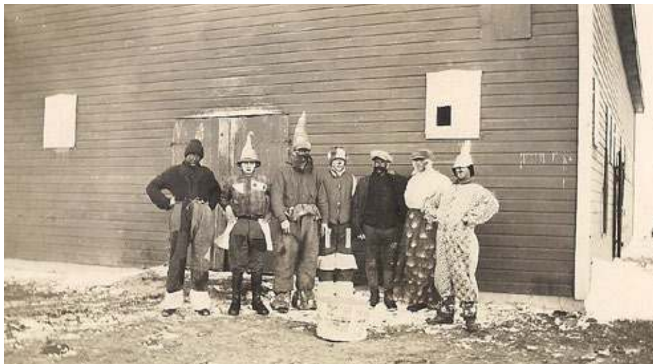
Fig. 2. Acteurs de Brommtopp de la région de Plum Coulée, le 31 décembre 1930.