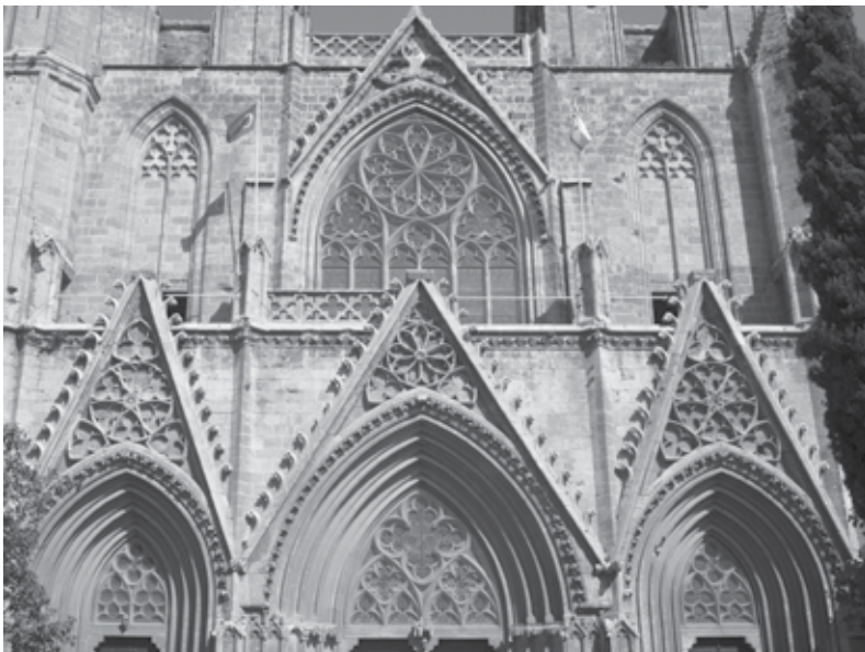
12. Vue de la façade de la cathédrale latine de Saint-Nicolas, aujourd'hui mosquée de Lala Mustapha, 1300-1320, Famagouste.

Selon cette classification, il faut compter Barcelone, Tunis et Dubrovnik parmi les centres d'une importance politique mais sans équivalence dans le domaine artistique, tout comme Gênes qui était un centre politique majeur dont le poids artistique était relativement insignifiant. Cependant, ses habitants ont joué un rôle incontestable dans le développement des relations artistiques interculturelles, notamment dans la partie est de la région méditerranéenne et sur les rives de la mer Noire 30 . Des centres latins au Levant, comme Jérusalem, Acre et Famagouste 31 ont été des centres d'échange artistique très importants. Évidemment, Jérusalem avait un