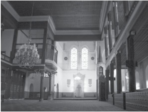
5. Église dominicaine de Constantinople/Pera construite au début du XIV e siècle, aujourd'hui appelée « mosquée des Arabes » (Arap Camii), Istanbul.

« byzantin », mais avec une iconographie clairement franciscaine ou dominicaine, ou en tout cas ancrée dans la tradition de l'Occident latin (fig. 5) 22 . D'une certaine façon, ces bâtiments sont le fruit d'une constellation très spécifique, voire contingente, de protagonistes, mais ils sont aussi le résultat d'un mélange adroit d'éléments étrangers et familiers. Pour prospérer dans la Méditerranée orientale, les ordres mendiants devaient être perçus comme une force nouvelle mais pas totalement autre. La nouveauté de leur message n'était acceptable que si celui-ci revêtait l'apparence de formes familières 23 .