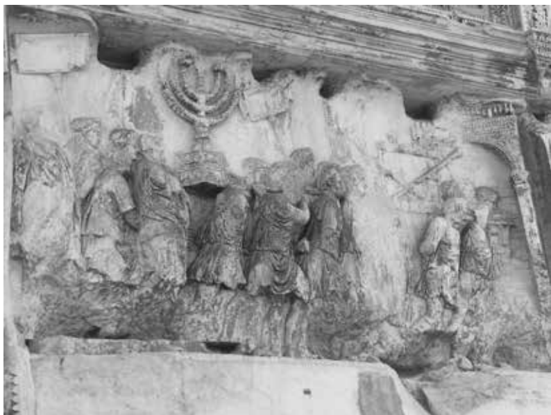
2. Procession triomphale après la destruction et le pillage du temple de Jérusalem figuré sur l'arc de Titus, Rome, 81 après J.-C.

ser à des périodes, des produits, des acteurs ou des centres particuliers. Selon l'intérêt pour le commerce des tissus de soie, des objets faits d'ambre ou des colonnes en marbre du Proconnèse, les itinéraires et les distances de commerce et d'échange diffèrent. Les réseaux du Haut Moyen Âge ne sont pas les mêmes que ceux qui seront actifs après les croisades. Le réseau éminemment personnel du souverain Théodore dans l'Italie des Ostrogoths (493-526) – par ses relations avec Byzance, l'Afrique vandale et les Francs – n'avait rien de comparable au réseau commercial d'une ville marchande de la fin du Moyen Âge comme Venise ou Gênes. Sa raison d'être n'était pas liée au commerce mais aux alliances politiques. Si nous suivons l'odyssée de la menorah du temple de Jérusalem (fig. 2) après la conquête romaine de Jérusalem en 70 de notre ère – de la Palestine à Rome, de Rome à Carthage, de Carthage à Constantinople puis de nouveau à Jérusalem –, cette histoire est davantage liée à la politique et à la guerre qu'à un réseau commercial ou artistique 12 . Même si les conséquences pouvaient être analogues, les objets voyageaient pour des raisons multiples et variées, ce qui se vérifie aussi pour les hommes.