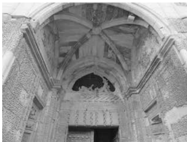
7. Portique oriental de la mosquée Sungurbey, 1335, Niğde (Turquie).

Gerhard Wolf. À côté de l'auto-perception d'un groupe, je placerais la perception par les autres. Il en va de la construction d'une identité et des politiques de l'identité. Tandis que les prémisses traditionnelles de l'histoire de l'art adoptent les autres comme point de départ, il serait important, dans une histoire de l'art méditerranéenne ou transrégionale en général, d'étudier comment ces perspectives se croisent et comment elles suscitent, répandent ou transforment certaines formes, certains symboles déterminés et certaines pratiques esthétiques. Même des œuvres d'art, qui s'établissent d'abord à travers l'auto-perception, participent d'une culture visuelle et intègrent ou combinent des éléments également compréhensibles pour d'autres : elles deviennent donc éloquentes dans un espace au-delà de celui de l'affirmation de soi du groupe.