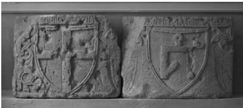
8. Dalles de fondation de la tour Giovanni de Scaffa (1342) avec les armes de Gènes et tamga des Djötchides, Théodosie, Musée des Antiquités de Théodosie.