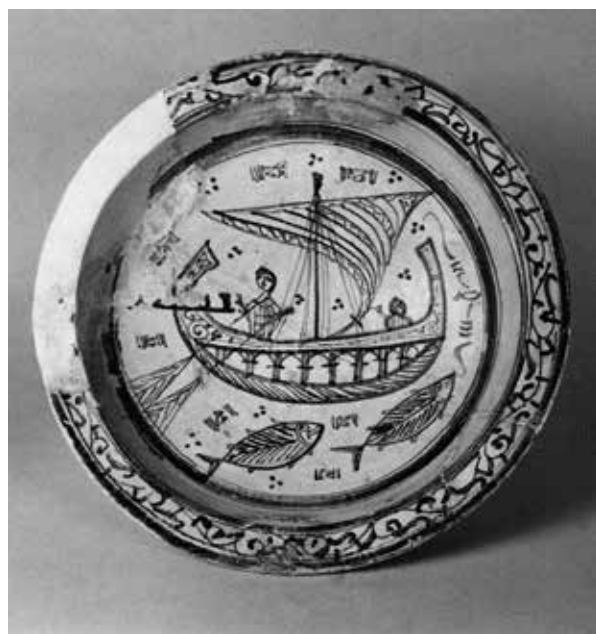
11. Bacino , atelier céramique du Maghreb, XII e siècle, Pise, Museo nazionale di San Matteo.

Michele Bacci. Si la Méditerranée peut être décrite comme un réseau d'échanges inter-culturels, quels sont les centres qui ont joué un rôle fondamental en tant que carrefours artistiques ? Ces sites correspondent-ils invariablement à des centres politiques majeurs, ou bien l'histoire de l'art doit-elle aussi prendre d'autres facteurs en compte ?