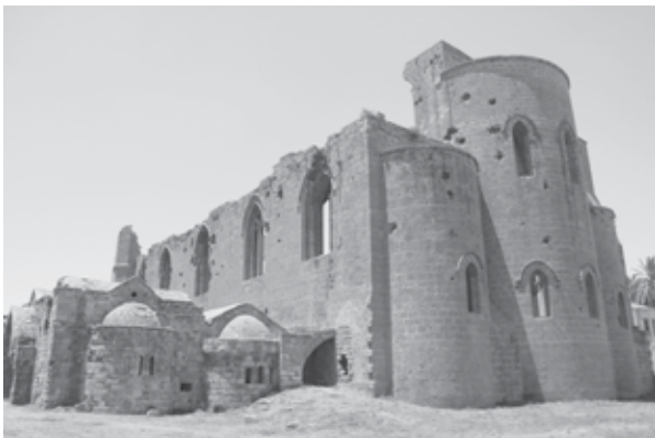
6. Église Saint-Georges-des-Grecs, vers 1360-1370, Famagouste.

En quoi de tels exemples affectent-ils notre perception de l'importance de l'espace culturel méditerranéen ? Ils semblent confirmer ce qui était clair dès le début, à savoir que la Méditerranée a été le théâtre de relations interculturelles sans être pour autant génératrice d'un langage artistique commun et cohérent. Les forces sous-jacentes derrière le dynamisme des importations, des exportations et de la combinaison d'éléments visuels dans les œuvres d'art étaient (et demeurent) en premier lieu les conditions historiques, les appartenances spirituelles, les choix politiques et les préférences artistiques. La géographie joue certainement un rôle, mais pas le principal.