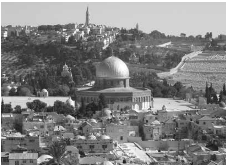
13. Vue du Haram es-Scharif et du mont des Oliviers, Jérusalem.

est sainte pour les trois religions abrahamiques. Appartenant à la terre comme au ciel, elle est porteuse d'une signification historique et religieuse sans pareil depuis plus de trois mille ans. De tout temps, elle a été citée et traduite, reproduite visuellement et reconstruite dans le monde entier, à un rythme et avec une intensité inconnue par les autres villes. En tant que telle, Jérusalem apporte à cette région une dimension universelle (et pas simplement mondiale !), ancrée dans son histoire, dans la Bible et dans le Coran, dans l'autorité de ses lieux saints ( loca sancta ) qui recouvrent la mémoire d'événements exceptionnels (fig. 13). Cet universalisme de Jérusalem repose sur la