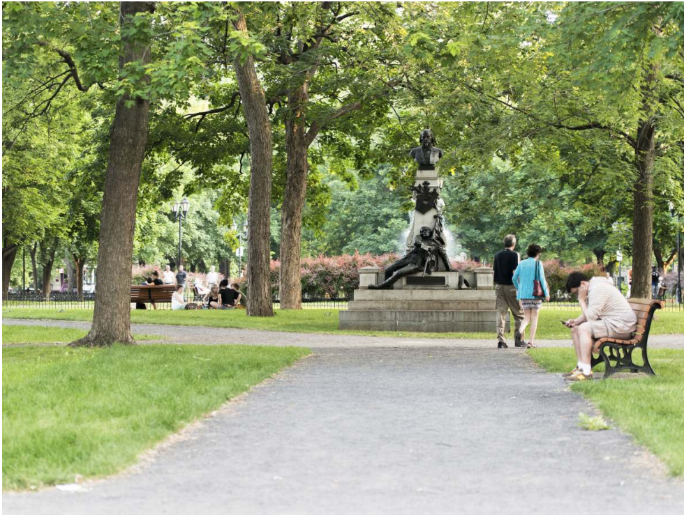
Collection d'art public de la Ville de Montréal.