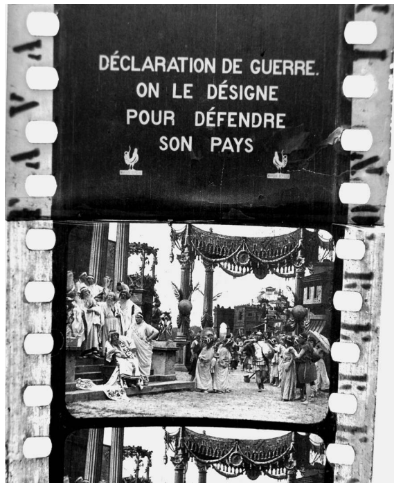
La Vestale : copie d'origine avec intertitre Pathé.

Note: Le contretype date de 1974. Les intertitres présentaient un problème de contraste important. La copie a été tirée en 2012.