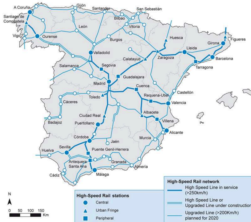
Figure 1 : Lignes espagnoles à grande vitesse ferroviaire et situation des gares, janvier 2014

«intégrale» d'après les promoteurs, pour 30.000 personnes, avec un total de 9.500 logements planifiés. Le train a été mis en service en 2003, mais en 2010, seul un terrain de golf avait été construit et 1.500 logements avaient été livrés à leurs propriétaires. La ville compte actuellement environ 3.000 habitants (Prada, 2010). Une opération immobilière clairement spéculative. Le cas de Valdeluz est devenu l'un des symboles les plus représentatifs des effets territoriaux de l'expansion du secteur de la construction en Espagne pendant les années 2000 et de l'explosion ultérieure de la bulle immobilière en 2008.