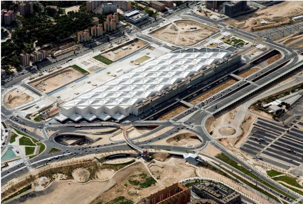
Figure 4 : La gare intermodale Saragosse-Delicias

bâtiment qui inclut la gare intermodale avec des services de train conventionnel, les nouveaux trains de banlieue et les TGV, en plus d'une gare routière. La gare comprend aussi un hôtel, des commerces et des restaurants.