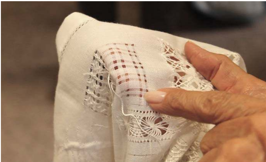
Figura 6. Ejemplo de puntada a medio hacer.

La repetición, el hacer y deshacer son clave para el aprendizaje. Si bien son las manos las que recuerdan cómo bordar, “si lo pienso mucho no me sale, me toca hacerlo y ya” (Maestra bordadora 65 años), en ocasiones repetir la puntada mentalmente es una ayuda para recordarla, “incluso cuando duermo me imagino cómo mover la aguja para que no se me olvide” (Maestra bordadora 70 años). Los dechados también ayudan en este proceso, no solo porque se constituyen en plataformas para practicar, sino porque en muchas ocasiones las maestras bordadoras dejan en estos muestrarios las puntadas a medio hacer, de modo que puedan luego redescubrir el proceso a la inversa: desbaratando la puntada en el dechado (Figura 6).