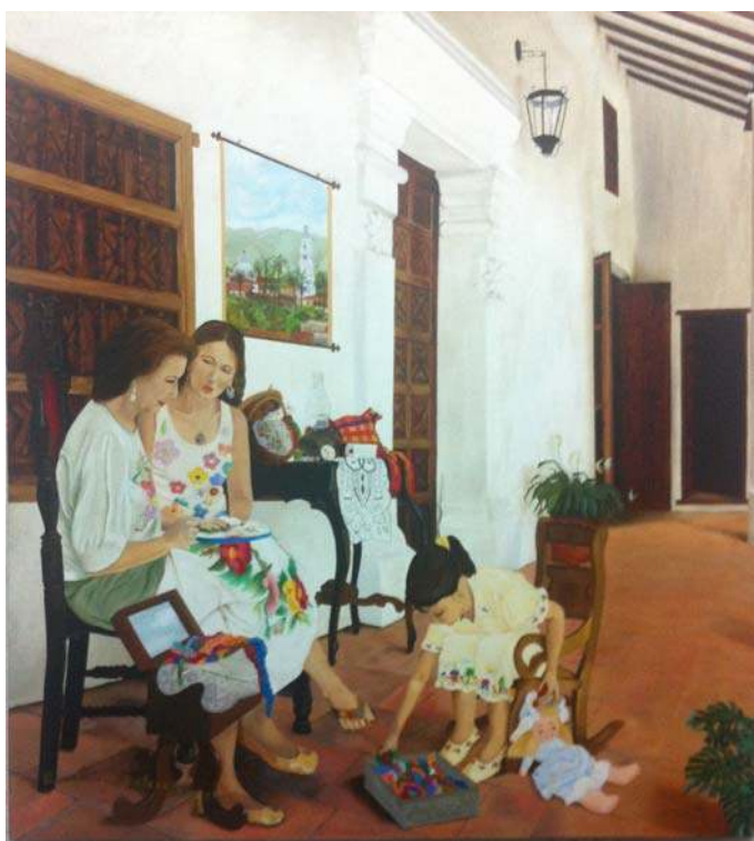
Figura 4. Cuadro de bordado en el hogar. Casa de la Cultura, Cartago.

aprendido en el colegio y bordaban lencería en su tiempo libre, con el objeto de embellecer su hogar o de nutrir sus amistades al regalar esporádicamente a otras amas de casa piezas bordadas por ellas. 9 Entre otras cosas, también bordaban ajuares de bautizo para sus hijas e hijos recién nacidos o prendas de vestir para ellas o sus hijas. En este contexto, el aprendizaje del bordado que se inicia con la formación religiosa en la escuela, va progresivamente insertándose en el interior del hogar, transmitiéndose de una generación de mujeres a otra (Figura 4).