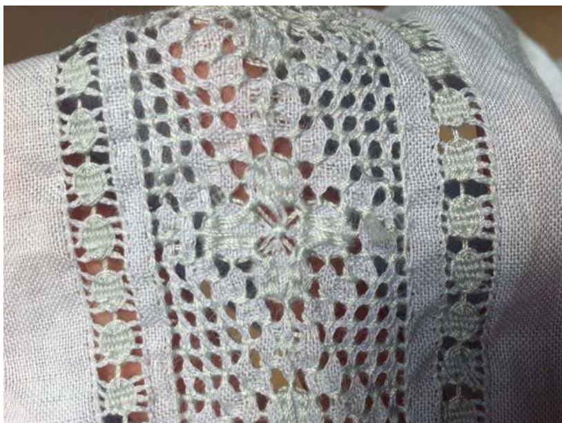
Figura 2. Calado en camisa para mujer.

En la investigación hemos encontrado que en la zona existe documentación 5 sobre el primer tipo de bordado al que referimos, pero no ocurre lo mismo con el calado, de allí que nos concentremos más en el aprendizaje y circulación del conocimiento en torno a esta técnica, entre otras cosas, como una apuesta por contribuir a la preservación de su saber-hacer. Como veremos más adelante, la principal fuente de conocimiento sobre el calado son las mismas expertas bordadoras, mujeres de la tercera edad que se van llevando consigo el conocimiento sobre esta labor, pues en la medida en que los procesos de deshilado y generación de patrones sobre la tela son dispendiosos y tienen poco reconocido monetario, las mujeres más jóvenes han perdido el interés en aprender a calar.