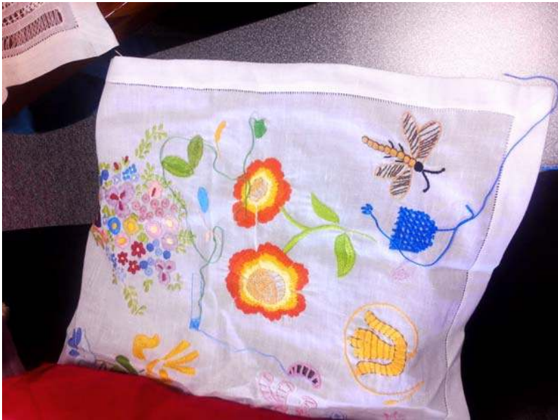
Figura 1. Dechado de bordado.

Respecto a la labor en sí misma hemos identificado dos tipos de bordado que se realizan en esta región. Uno de ellos se hace sobre la tela sin alterar su estructura y con hilos de distintos colores (Figura 1), y otro que se hace deshilando la tela, es decir, sacando hebras de la trama y la urdimbre que la configuran. En este segundo tipo de bordado se usan hilos del mismo color de la tela, incluso a veces los hilos que se usan para hacer puntadas sobre la tela son las hebras que se han retirado del textil, a este tipo de bordado se le conoce como calado (Figura 2). 4