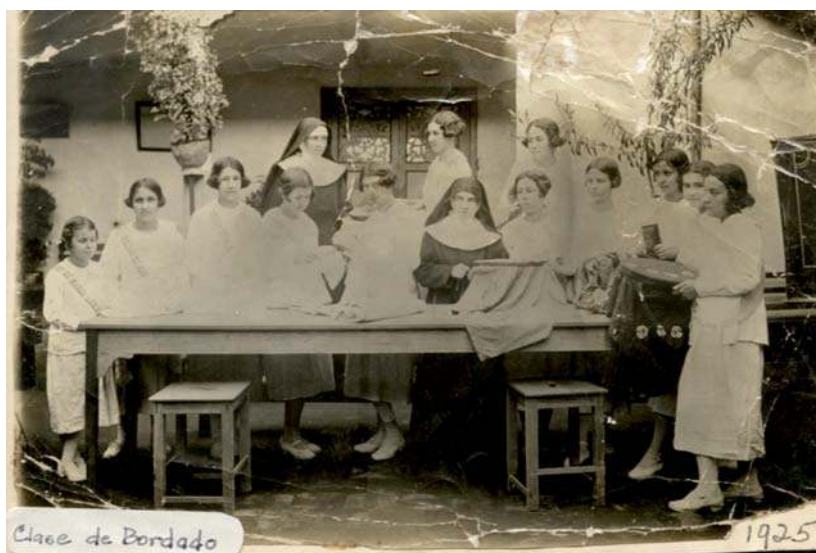
Figura 3. Clase de bordado, 1925. Archivo Casa del Virrey, Cartago.

(Asociación Probordados de Cartago, 2013). Como ha sido documentado para otros contextos (Edwards, 2006; Murphy, 2003; Parker, 2010), el bordado en Cartago fue originalmente aprendido por mujeres de clases medias privilegiadas, en tanto que labor femenina articulada al cuidado del hogar.