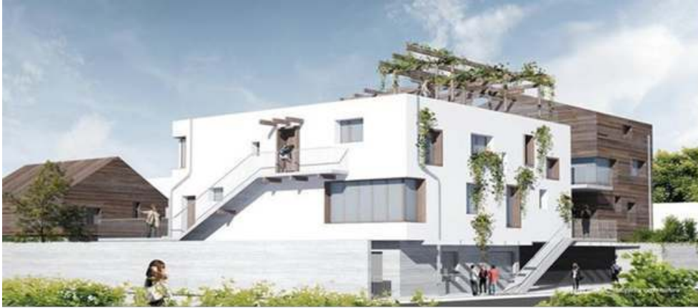
Figure 1. La maquette de « La Ruche »

de la première « botte de paille » a été inaugurée en février 2015. Ainsi, les délais annoncés pourraient effectivement être respectés avec une livraison du bâtiment au premier trimestre 2016.