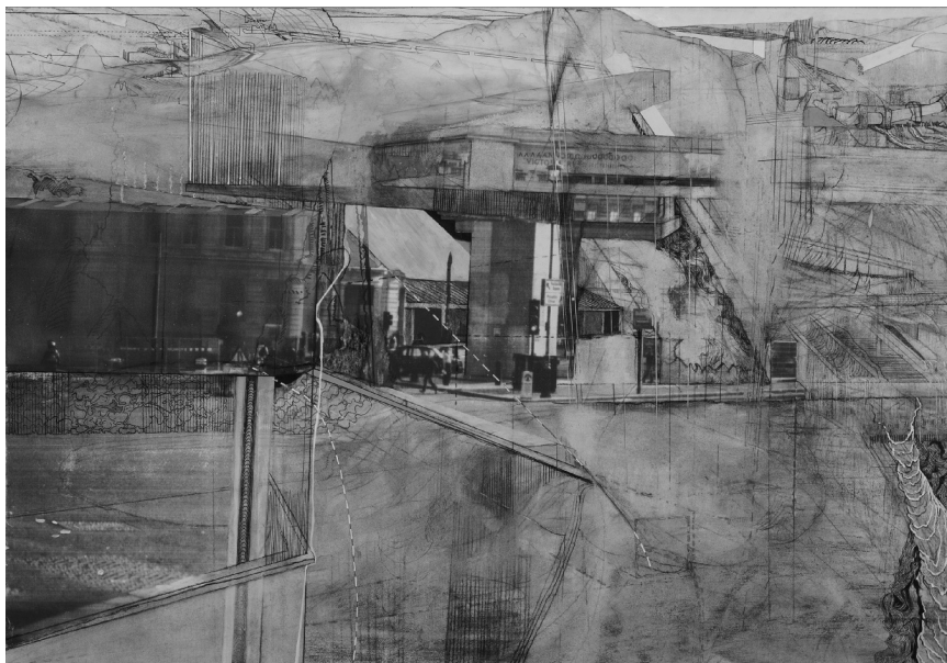
Ill. 1 : Alex Hamilton, Arch 6 , 2013, stylo et encre, fusain, pastel, peinture au pistolet, crayon à mine, gouache sur une photocopie de papier d'archive.