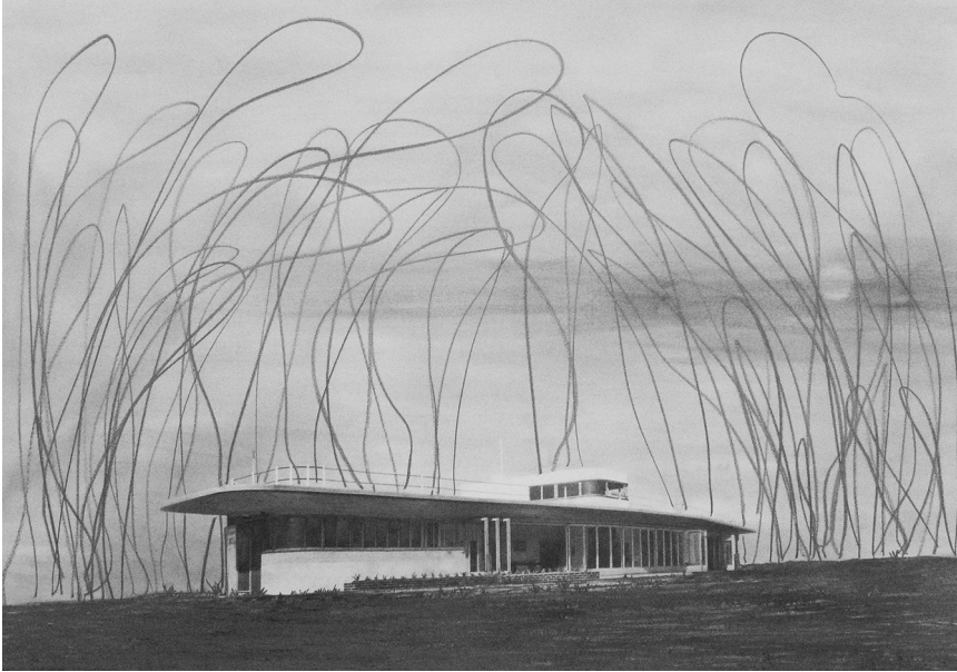
Ill. 3 : Stéphane Steiner, sans titre, extrait de la série Dessins d'architecture , 100 × 70 cm, graphite sur papier.

plafond, d'une vitre de voiture, du sable d'une plage, à l'écran d'ordinateur voire à l'espace (ill. 2) !