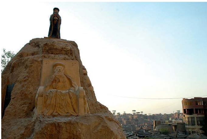
Les statues de Shenouda