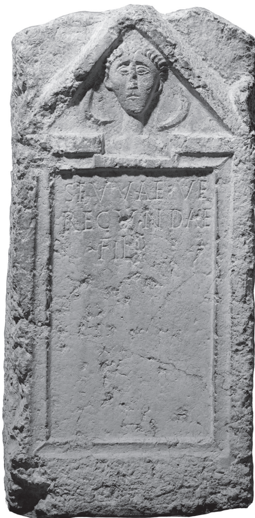
Fig. 1. Stèle de Genève. Musée d'art et d'histoire de la ville de Genève. Inv. N° EPI 0537. Document transmis par Angelo Lui.

Dans un cas, les auteurs modernes considèrent qu'il n'a aucune signification précise. Les sculpteurs n'avaient aucun souci du réalisme. Le premier artisan sollicité a gravé une lune cornes vers le haut, sans raison; les autres l'ont imité sans réfléchir. D'ailleurs Pline l'Ancien ne mentionne pas le phénomène de la lune en berceau dans les passages qu'il consacre à cet astre ( HN , II, 11: premier et dernier quartier; voir II, 32 et 72; XVIII, 75 et 79). Cette explication paraît toutefois un peu courte: il serait étonnant que, sur 255 sculptures, aucune n'ait dérogé à la règle. De plus, les artisans savaient sculpter le croissant de lune ordinaire, tourné