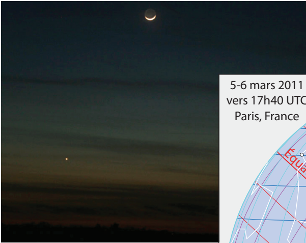
▲ Fig. 2a. Lune en berceau et Vénus, le 17 mars 2010.