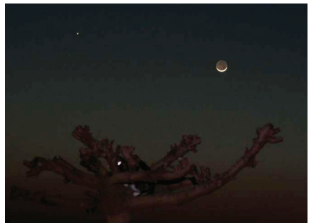
Fig. 3a. Lune en berceau et Jupiter. Dans l'arbre, le chat médite. Son collier et la lune, eux, réfléchissent. Photographie O. Gayard. Reflex 350 D, focale 100 mm ; temps : 1,3 s pour une ouverture de 5,6. ISO 1600.

En résumé, la lune en berceau est un phénomène très rare, qui se produit une ou deux fois par an ; la lune est en croissance le soir, en décroissance le matin.