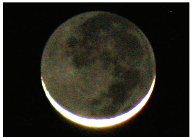
Fig. 3b. Lune en berceau le 6 mars 2011. Reflex 350 D, focale 300 mm ; temps : 1,6 s pour une ouverture de 5,6. ISO 1600.