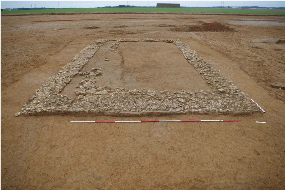
Bâtiment rectangulaire sur fondations de silex J. Palmer