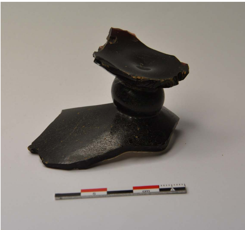
Pied de vase canthare en verre de type "Überfangglas" E. Winkel