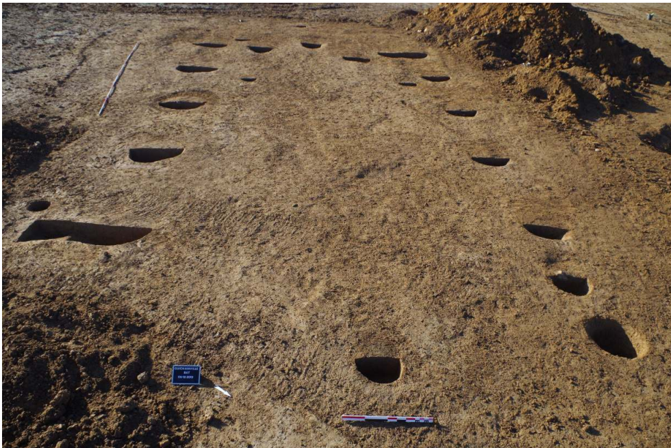
Grand bâtiment rectangulaire sur poteaux