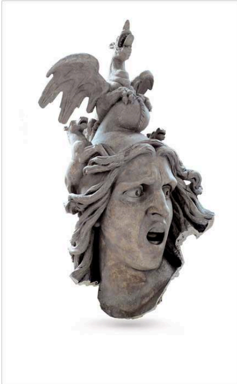
Moulage du Départ des volontaires (tête de la Renommée ).