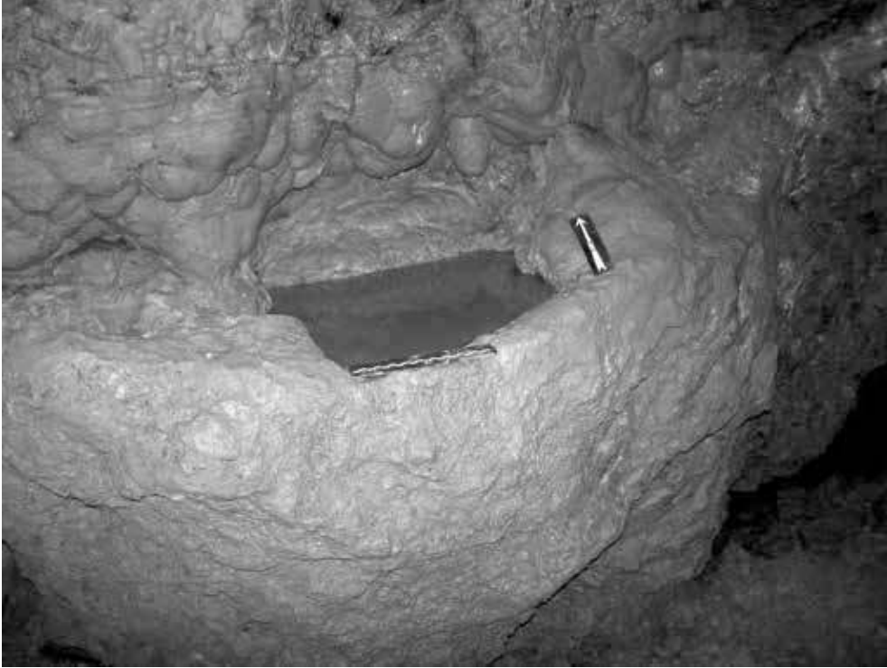
Fig 02 - Sorèze, grotte du Calel

Vasque installée dans une lame rocheuse naturelle, étanchéifiée avec de l'argile par les mineurs aux deux extrémités pour assurer la collecte d'eau percolant du plafond.