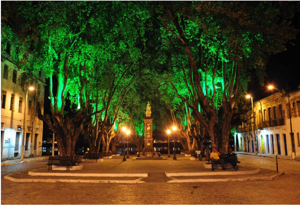
A Praça 25 de Março simboliza a luta e a vitória dos baianos na Independência da Bahia em 1822 do referido dia e mês que deu o nome à praça