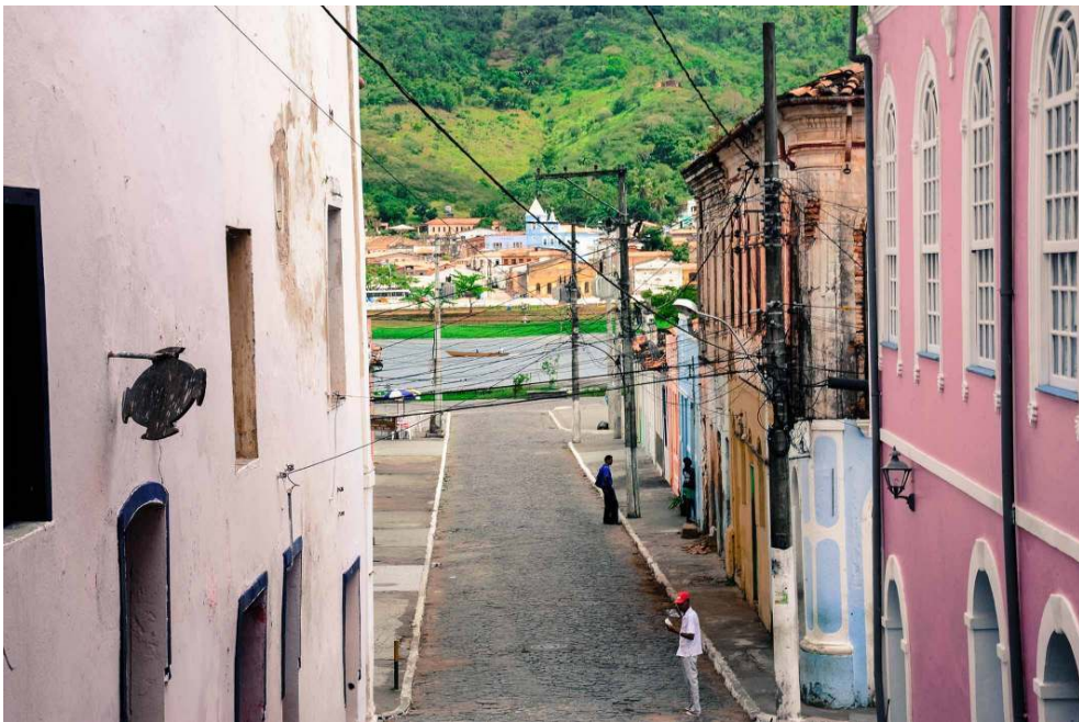
Ladeira D'Ajuda com vista para o rio Paraguaçu