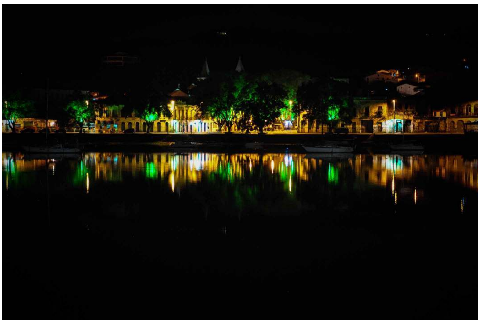
Vista noturna da cidade Cachoeira, Recôncavo Baiano