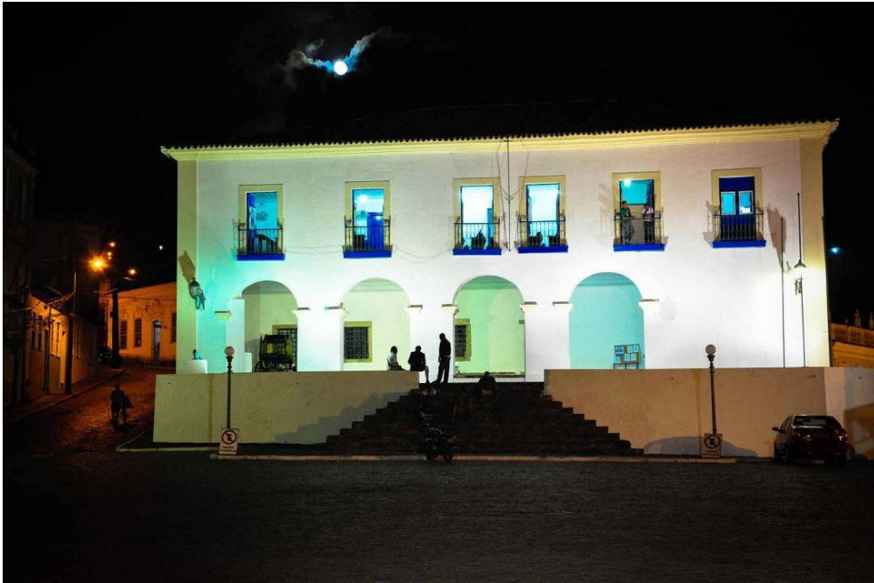
Praça da Câmara Municipal de Vereadores, antiga cadeia da cidade