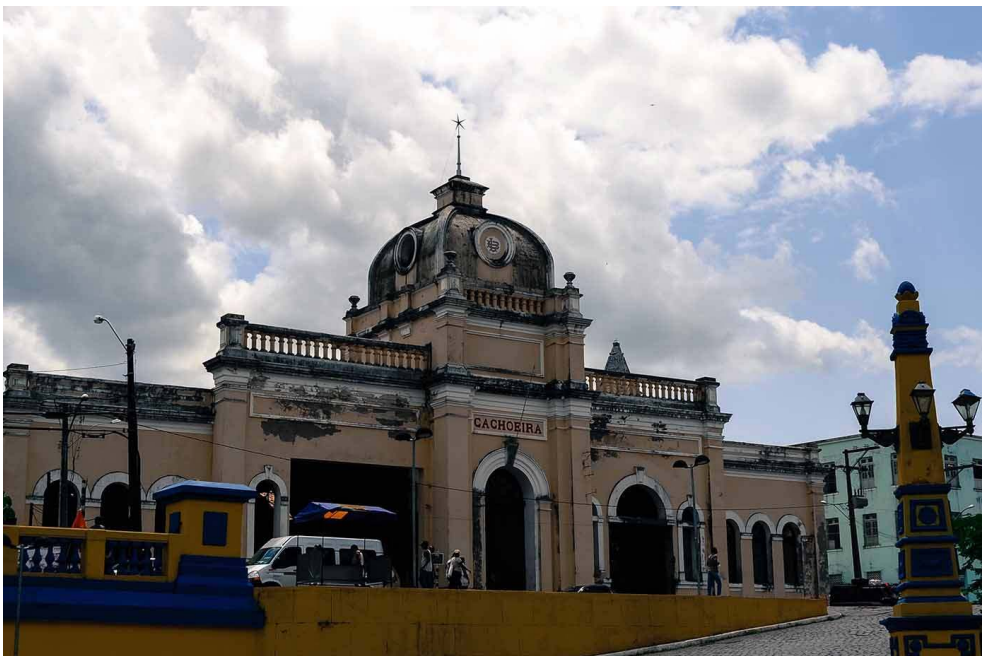
A estação de Cachoeira foi aberta em 1876. O prédio fica praticamente na margem do rio Paraguaçu