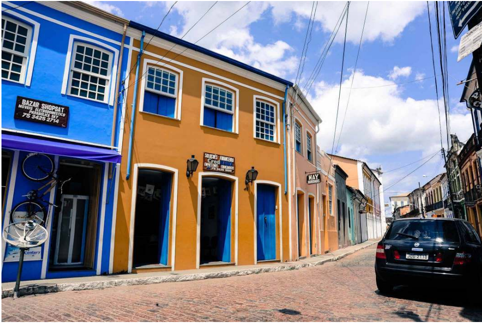
Rua estreita com imóveis antigos ainda bem preservados