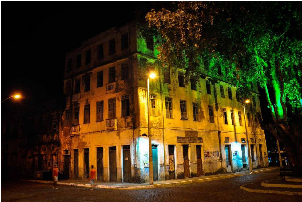
Prédio antigo onde funcionava a Hermes Distribuidora