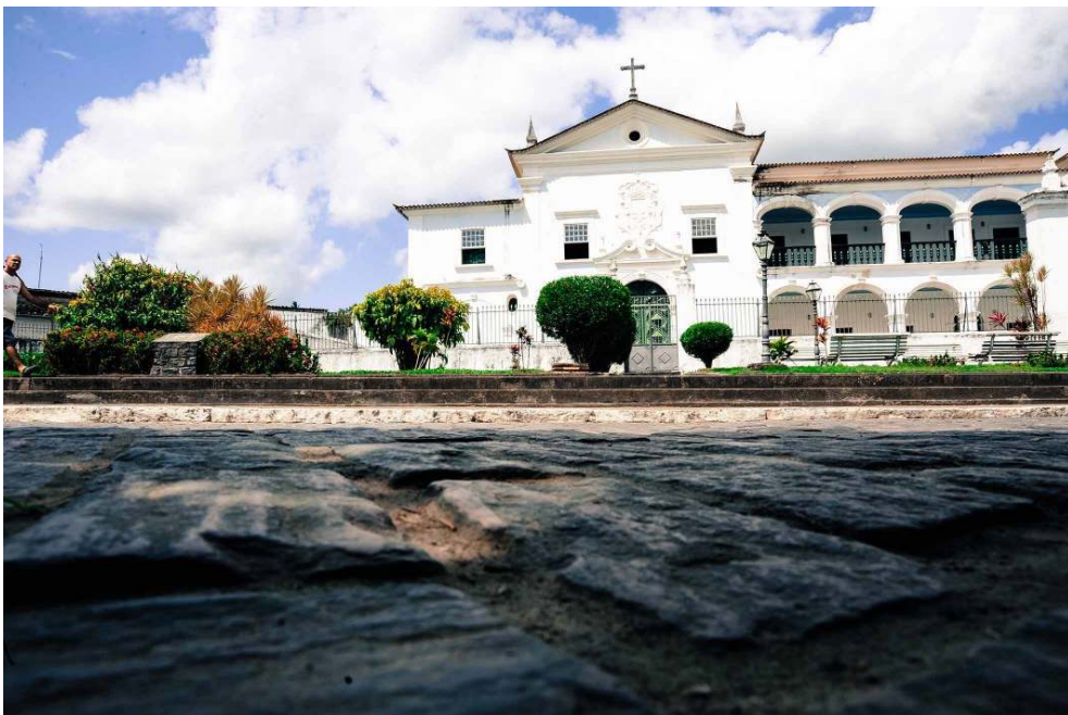
O Convento e Igreja de Nossa Senhora do Carmo, uma construção de 1715, em estilo barroco