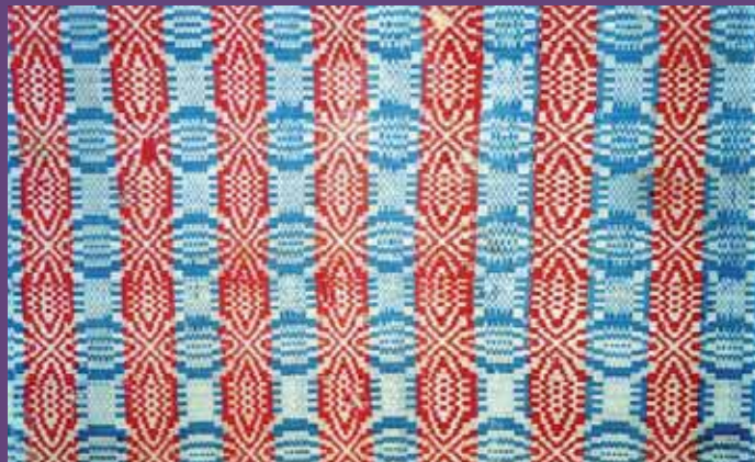
2b Couvre-lit cu năvădelă par Ruxanda Grădinariu