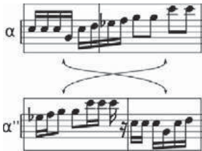
Fig. 3 Hora de la Botoșani (détail)

La parenté entre \alpha et \alpha' l'est beaucoup moins. Ce sont pourtant les mêmes hauteurs, les mêmes valeurs rythmiques (et pour les musiciens, les mêmes doigtés), mais un décalage métrique inhabituel – deux temps et demi – brouille cette fois les pistes. Il n'est pas certain que la conscience accède à cette organisation de détail. À l'écoute, on pourrait aussi entendre un nouveau motif ( \alpha'' ), en tête de la troisième partie. Ce serait même plus logique, compte tenu des articulations métriques