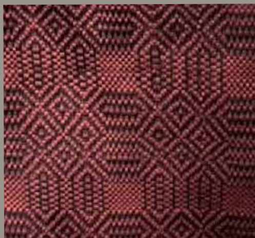
4b Petite couverture ( lăicer )