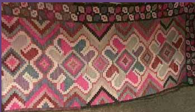
2c Tapis sans năvădelă par Marina Trifan