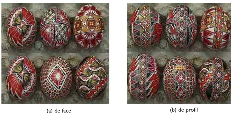
(a) de face

semaines après Pâques, ils seront échangés entre parents et amis, et gardés quelque temps en évidence, à la manière de bibelots ou de cartes de vœux. Si les tisserandes ne modifient que rarement les modèles du năvădit , la variation est la règle dans la décoration des œufs. Là encore, celle-ci agit de manière motivique, en combinant des figures préexistantes (Fig. 4). Mais alors que la marge de manœuvre des tisserandes est proportionnée à leur capacité de compréhension des algorithmes du năvădit , les peintres sur œufs peuvent, au moins, choisir leurs motifs indépendamment les uns des autres.