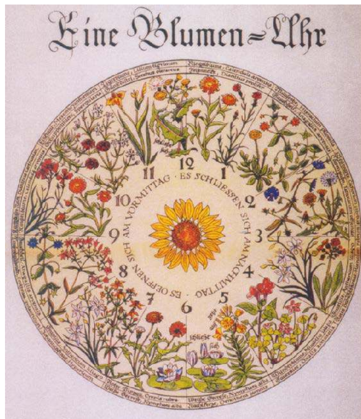
Figure 3 : Une horloge florale (Blumen-Uhr), telle qu'imaginée (et décrite espèce par espèce 5 ) par Linné en 1751.

Candolle aura d'ailleurs l'heureuse idée de voir dans ces rythmes foliaires un "sommeil des plantes", ce qui captera l'attention du public savant, en suggérant un lien, plus justifié qu'il ne l'imaginait peut-être, avec les cycles quotidiens des animaux. Ce "sommeil" sera étudié par la suite sur de nombreuses espèces végétales, notamment par le botaniste et physiologiste allemand Wilhelm Pfeffer (1845-1920) 4 . Linné lui-même avait remarqué que les fleurs de différentes espèces s'ouvrent (puis se ferment) à des heures différentes de la journée, et pas nécessairement au lever (et au coucher) du soleil. Il en avait conçu une horloge florale : un parterre circulaire où les différentes espèces seraient disposées selon les moments de la journée où elles écartent leurs pétales, de manière à y lire directement l'heure.