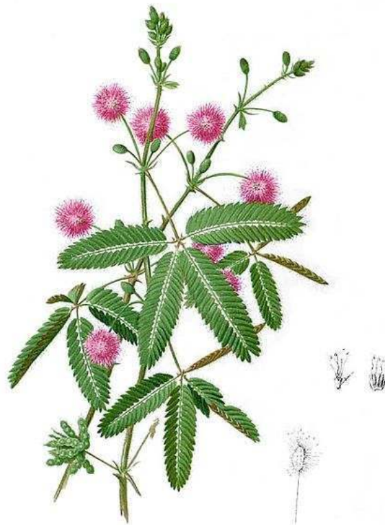
Figure 2 : Mimosa pudica, ou Sensitive.