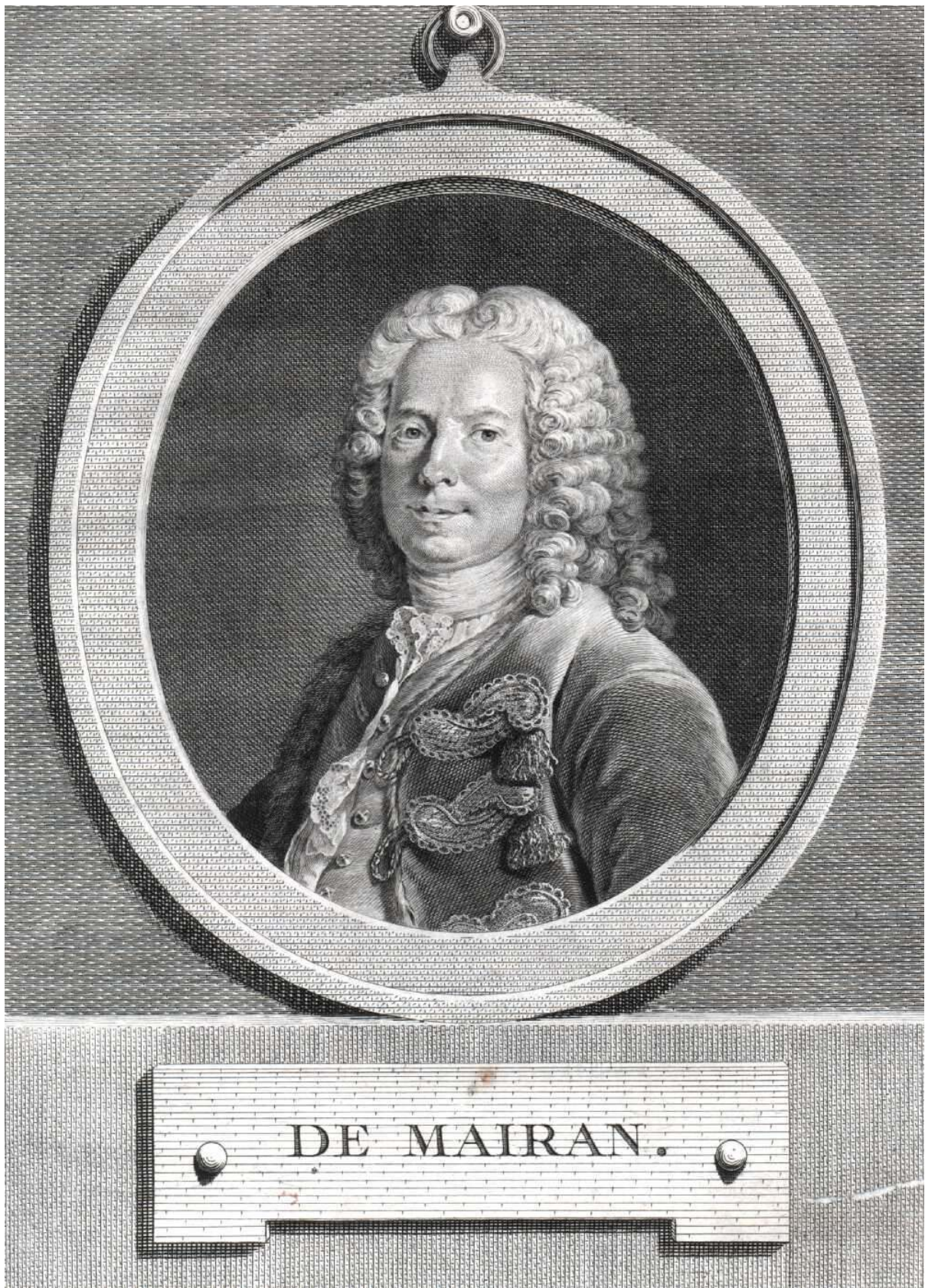
Figure 1 : Jean-Jacques Dortous de Mairan (1678-1771) (portrait par Louis Tocque, 1696-1772, gravure par Pierre-Charles Ingouf, 1746-1800).