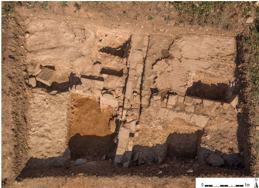
Fig. 2 – Image par drone.