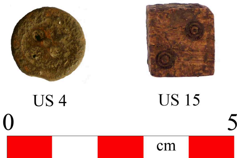
Fig. 17 – Mobilier provenant des US4 et US 15.