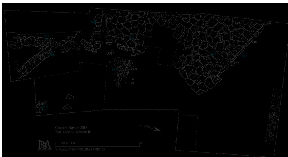
Fig. 15 – Plan du secteur D III.