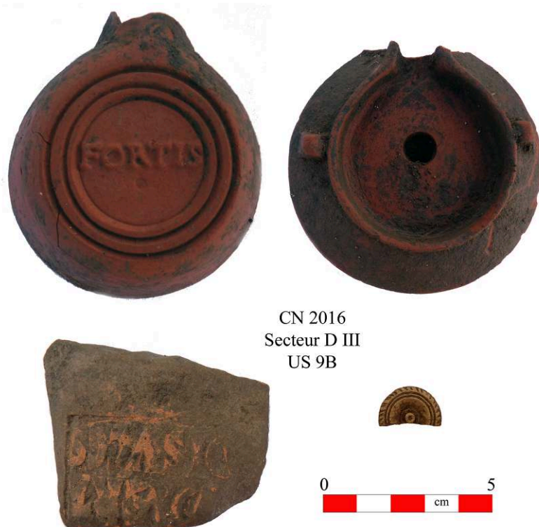
Fig. 14 – Estampilles et jeton en os provenant de l'US 9B.