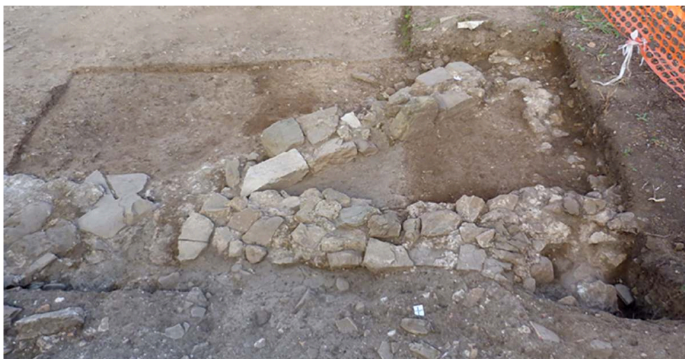
Fig. 16 – Photographie de détail des murs M5 et M6.