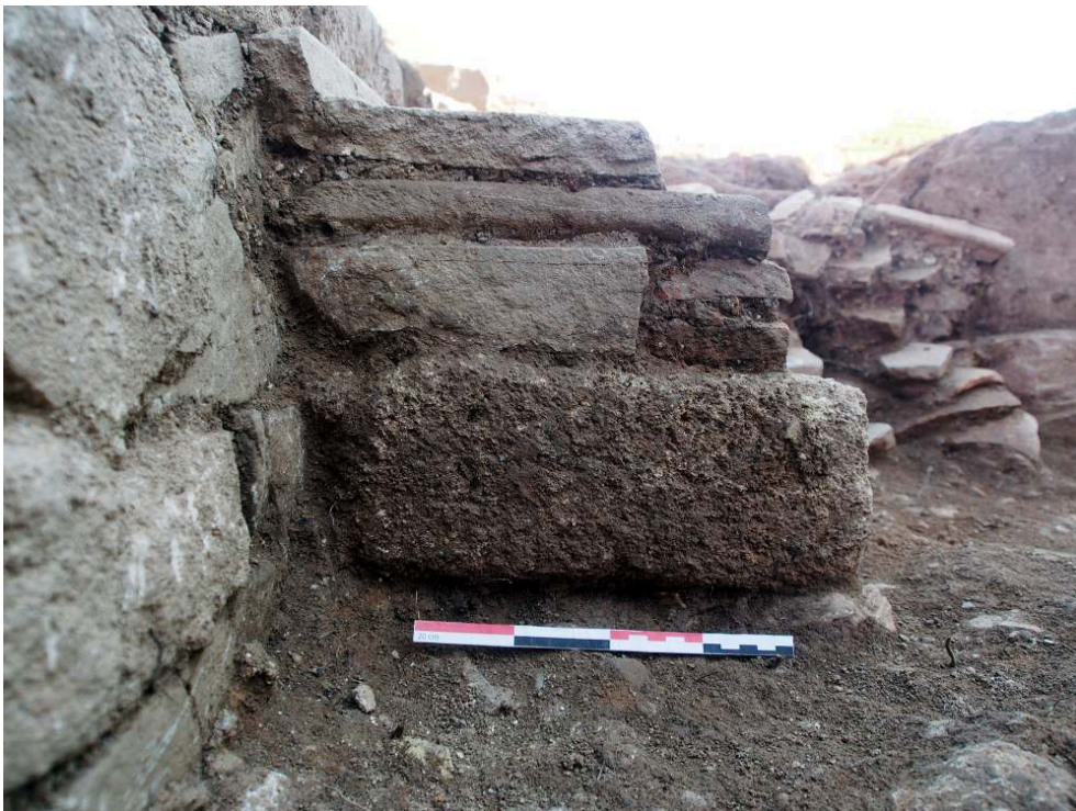
Fig. 4 – USM 13 et 15.