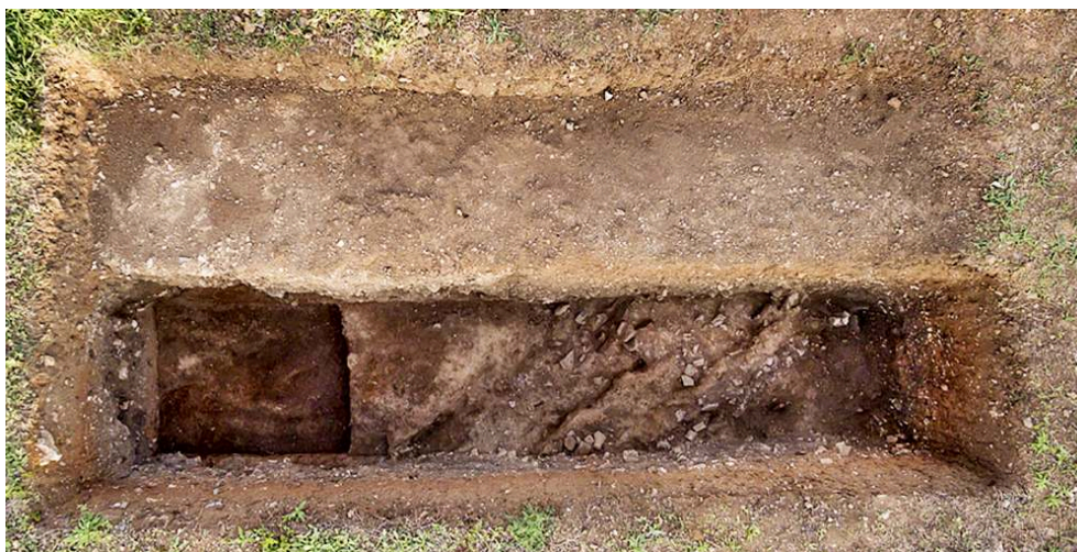
Fig. 18 – Vue aérienne du secteur D VI.