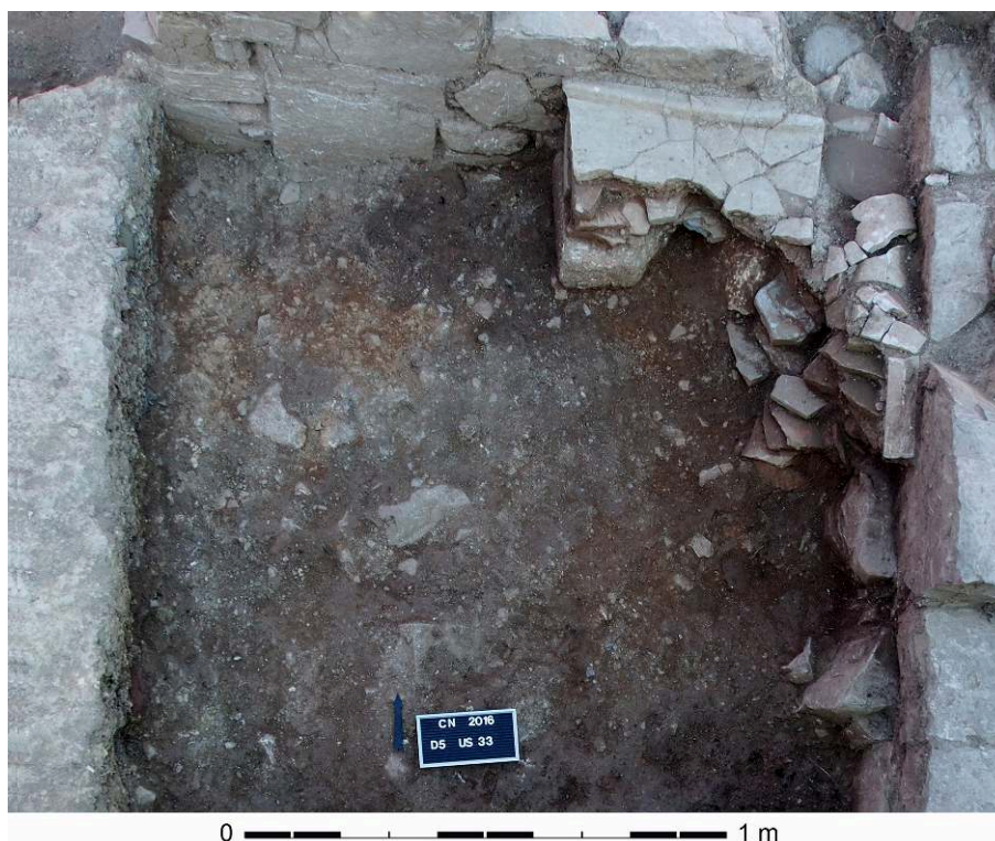
Fig. 5 – USM 13 et 15.