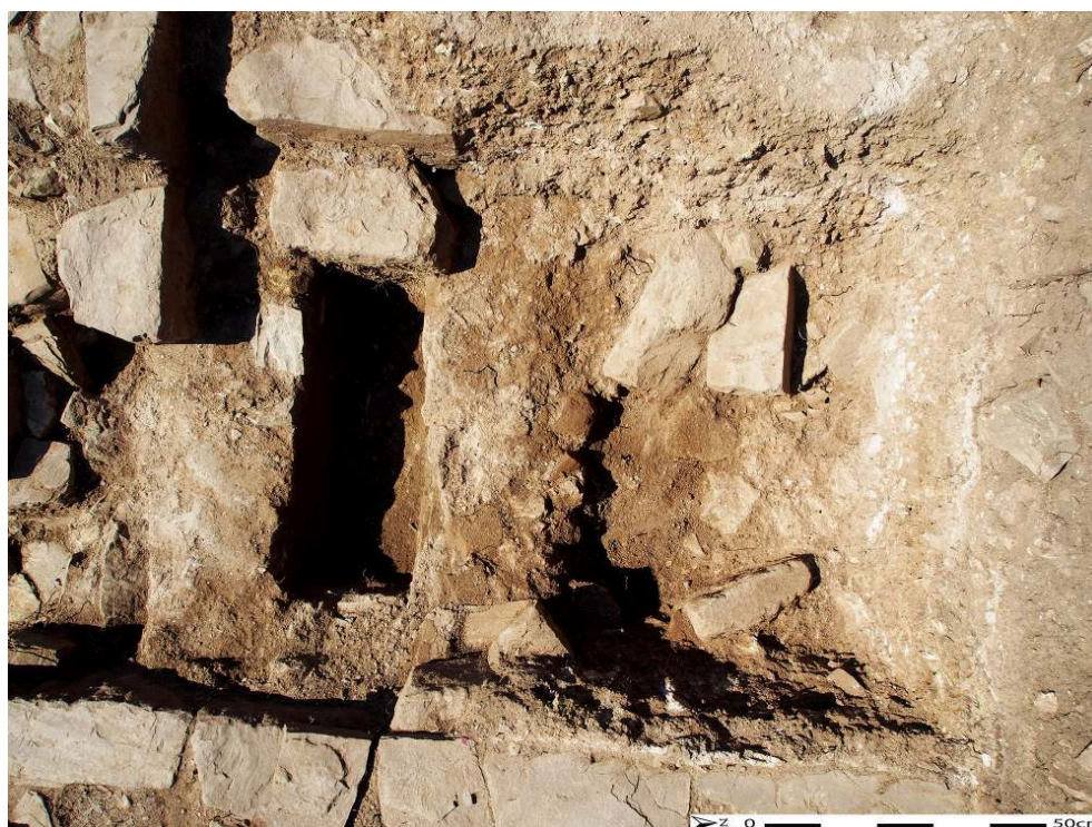
Fig. 3 – Le canal USM 16.