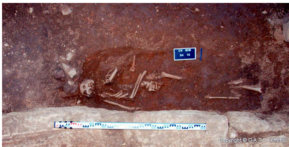
Fig. 12 – Tomba 1. Ricostruzione dello scheletro dai frammenti ossei dell'inumato infantile.

Nel caso in esame, in particolare, le avverse condizioni metereologiche durante la fase di scavo e di recupero dei resti hanno sicuramente inciso sullo stato di conservazione degli stessi. La stima dell'età al momento della morte è stata condotta in primis valutando il grado di eruzione dentaria secondo lo standard proposto da Ubelaker 22 . L'osso mascellare non si è conservato, tuttavia sono stati rinvenuti i due incisivi centrali permanenti, il canino permanente sinistro in formazione, la corona del primo premolare superiore sinistro, il primo molare permanente superiore sinistro e le corone dei secondi molari permanenti superiori. La mandibola ha invece mostrato un migliore stato di conservazione in particolare per quanto riguarda l'emiarcata mandibolare destra.