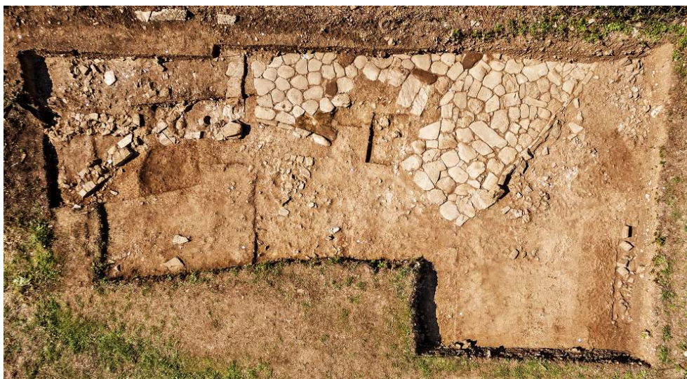
Fig. 13 – Photographie d'ensemble du secteur D III à la fin de la campagne de fouille 2016.