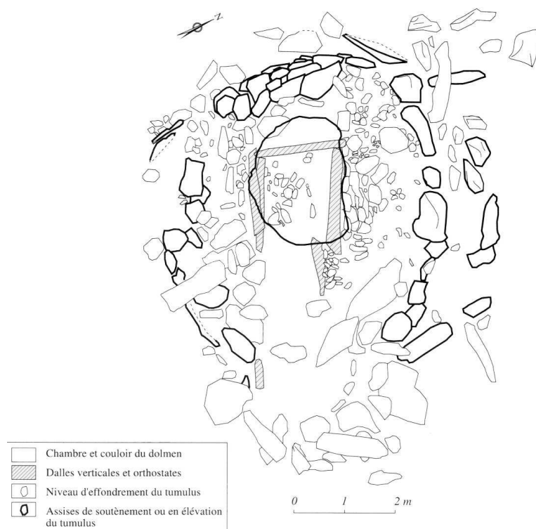
Fig. 2 – PLANIMÉTRIE DU DOLMEN DE LA CASA DI L'URCA