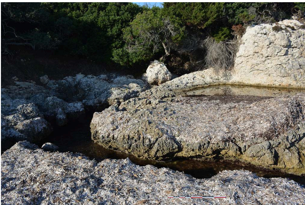
Fig. 2 – Excavation dans le calcaire à l'est de la villa de Piantarella