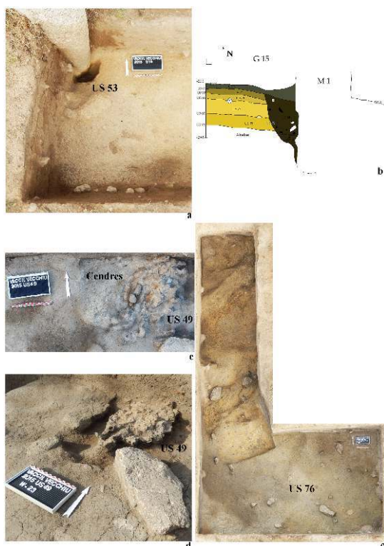
Fig. 2 – FOSSE DE M1, FOYER US49 ET SOL US76

a : photographie de la fosse de M1 après sa fouille ; b : coupe stratigraphique de la fosse de M1 ; c : orthophotographie du foyer US49 (secteur 2) ; d : photo du foyer US49 (secteur 2) après son détournement ; e : exemple d'orthophotographie réalisée par photogrammétrie (secteur 2, sol US76)