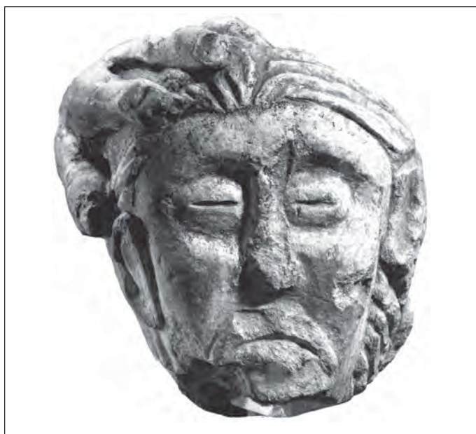
■ 1 Tête coupée en ronde bosse n° 27 de l'oppidum d'Entremont (Bouches-du-Rhône) (d'après Arcelin, Dedet, Schwaller 1992). Hauteur : 0,23 m.