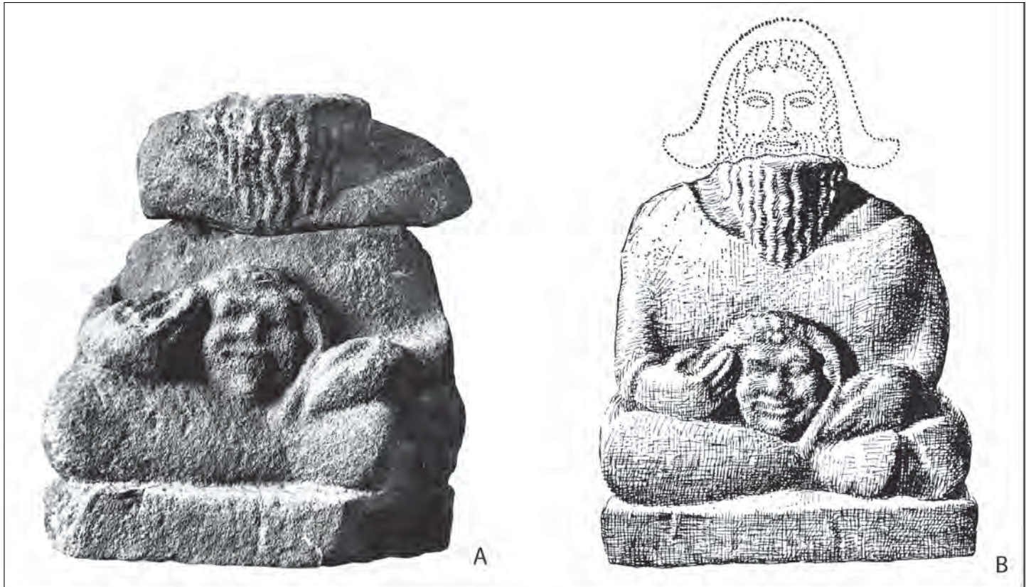
■ 2 Statue en ronde-bosse provenant de Bourière (Aude) (d'après Arcelin, Dedet, Schwaller 1992). Hauteur actuelle : 0,55 m. A : les éléments conservés au Musée de Limoux (cl. : G. Barruol, U. Gibert et G. Rancoule) ; B : reconstitution avec la tête, perdue après la découverte (dessin : N. Calabro).

insertions musculaires puissantes, a plus de chances d'appartenir à un homme, et un crâne gracile à une femme. En tous cas, des études ostéologiques récentes sur plusieurs sites vont dans ce sens. C'est le cas à Entremont pour les crânes découverts par F. Benoît dans le sanctuaire de la seconde moitié du II e s. av. J.-C., qui sont très majoritairement robustes (Mahieu 1998, 62-64). Les deux crânes provenant d'une porte de l'oppidum de La Cloche près de l'étang de Berre, datée de la première moitié du I er s. av. J.-C., appartiennent aussi à des adultes robustes (Mahieu 1998, 64-65). Des deux crânes également découverts à l'entrée de l'oppidum de Buffe Arnaud dans les Préalpes de Provence, l'un signale un adolescent ou un adulte très robuste, tandis que l'autre marque un adulte moins robuste, tous deux exposés là vers la fin du II e s. av. J.-C. (Duday in Garcia, Bernard 1995, dossier e). Les crânes exposés, à l'exclusion de toute autre partie du corps, au bord du rempart de l'habitat gardois du Cailar, sans doute près de la porte au III e s. av. J.-C., appartiennent toujours à des sujets de taille adulte et deux arguments sont en faveur d'individus masculins, leur morphologie souvent robuste et l'accompagnement de nombreuses armes (Roure et al. 2011, 148-149). Également, à la même époque en Catalogne, sur l'oppidum du Puig de Sant Andreu à Ullastret